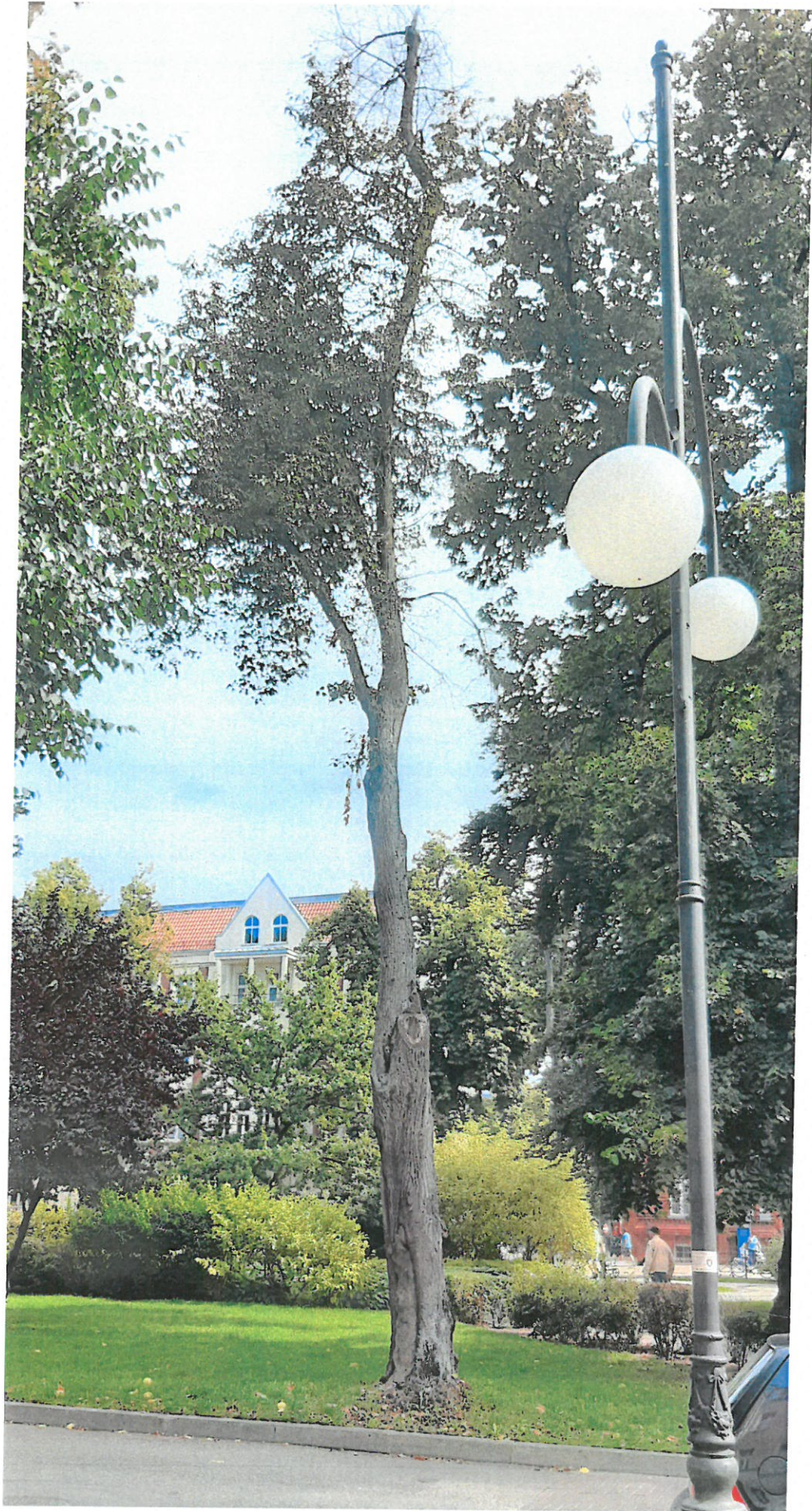
DRZEWO NR 2