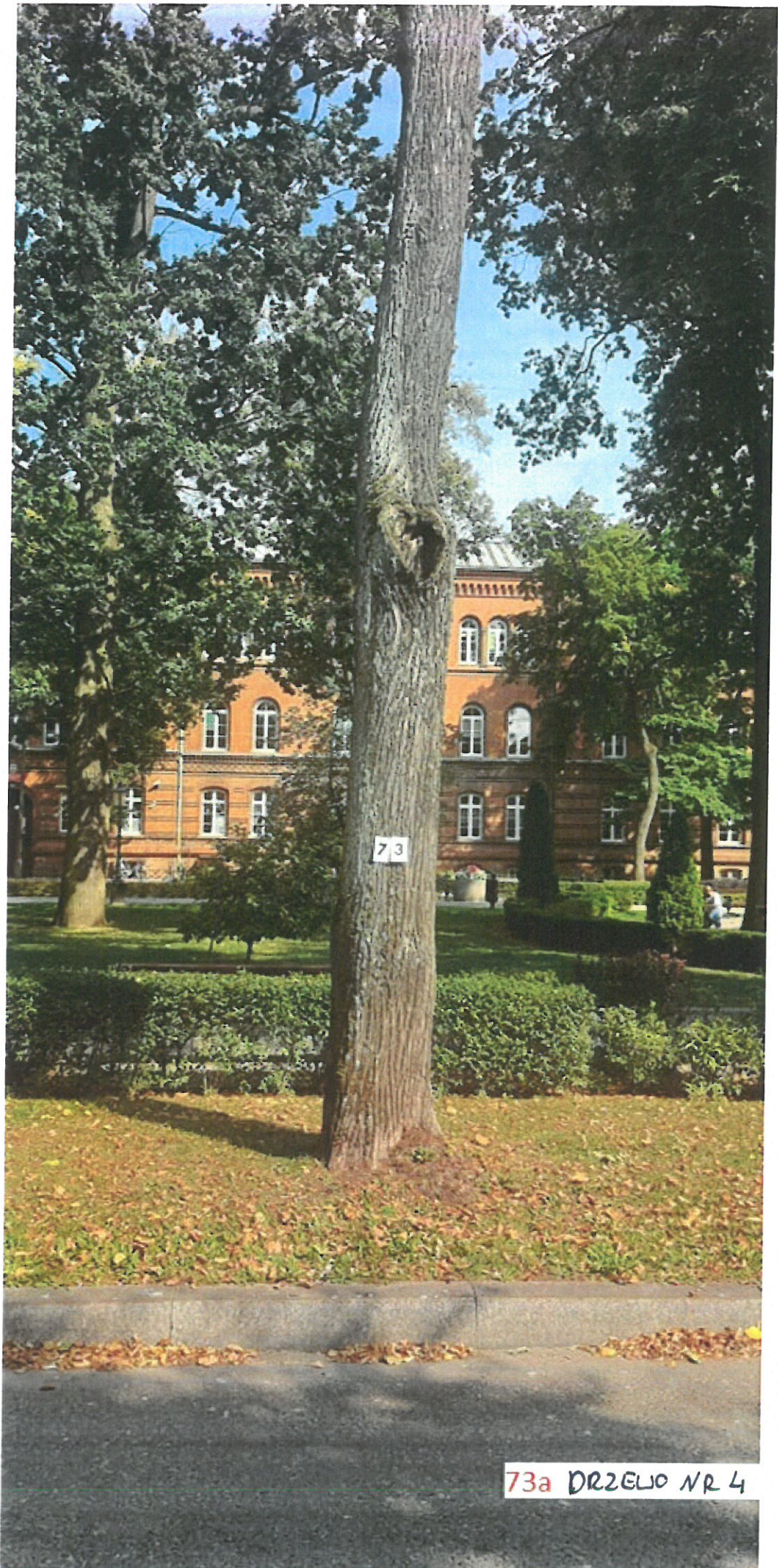
73a DRZEŁO NR 4