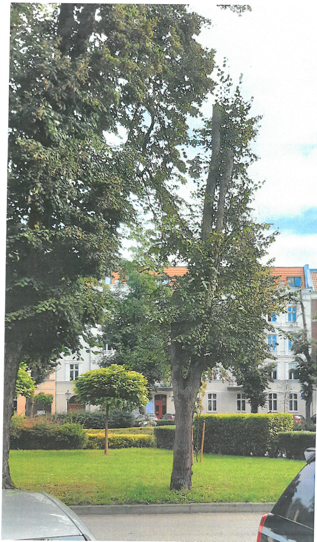
DRZEWO NR 1