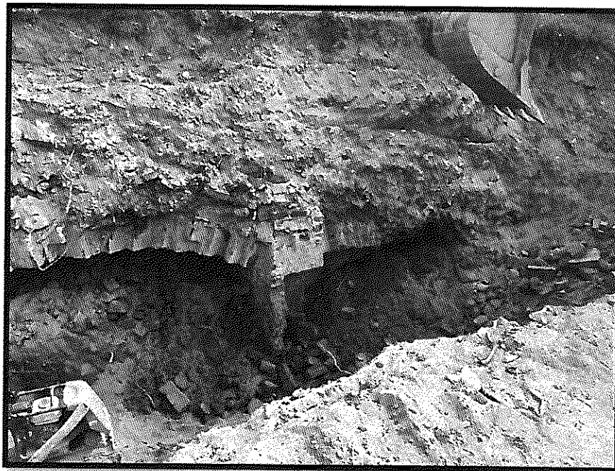
Ryc. 2 Zdjęcie murów piwnicy