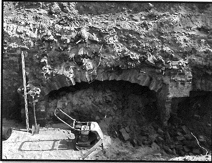
Ryc. 1 Zdjęcie murów piwnicy

siedziba i adres korespondencyjny: Lubsin 13, 88-230 Piotrków Kujawski