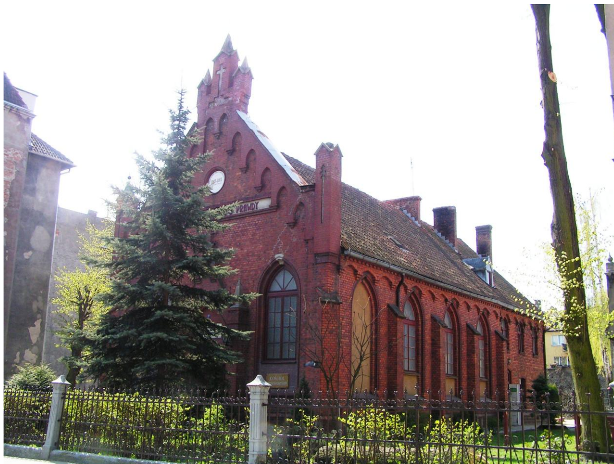
Kościół baptystów