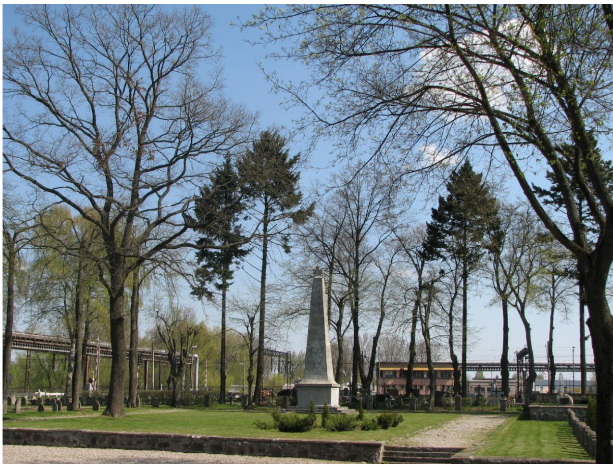
Wojenna część cmentarza komunalnego przy ul. Cmentarnej, fot. M. Karczewska

Cmentarnej znajduje się wojskowa część cmentarza z umieszczonym centralnie obeliskiem. W tej części cmentarza znajdują się mogiły żołnierzy niemieckich (177 mogił), rosyjskich (234 mogiły) i jednego żołnierza francuskiego, poległych i zmarłych w czasie I wojny światowej; mogiły żołnierzy i policjantów niemieckich z okresu międzywojennego, a także mogiły żołnierzy polskich poległych w czasie kampanii wrześniowej w 1939 r. i w drugiej połowie lat 40-tych XX w.