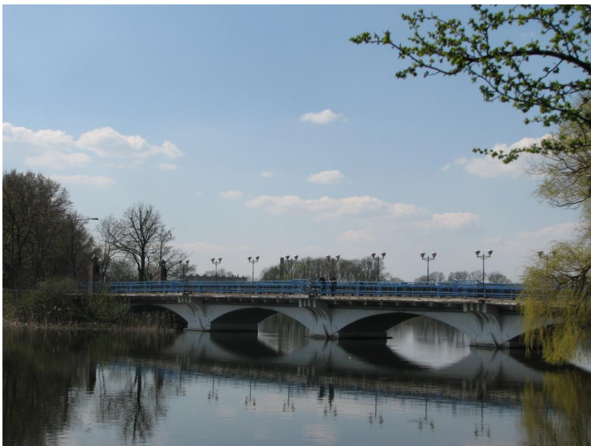
Zabytkowy most łączący miasto z wyspą zamkową