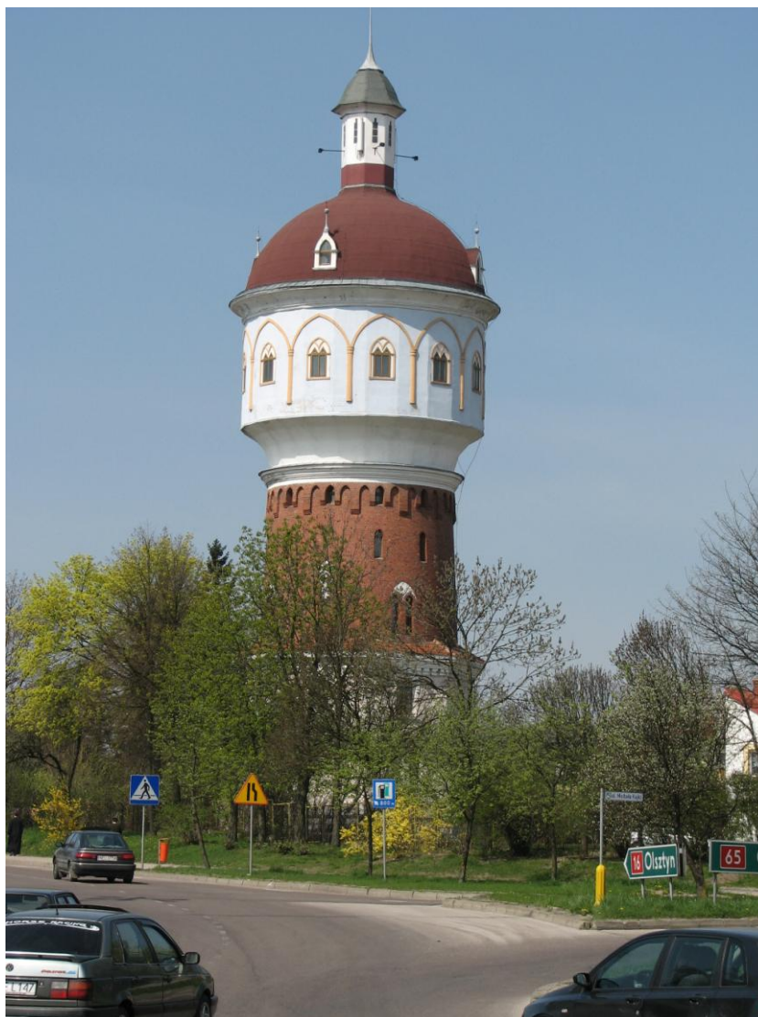
Wieża ciśnień w krajobrazie miasta