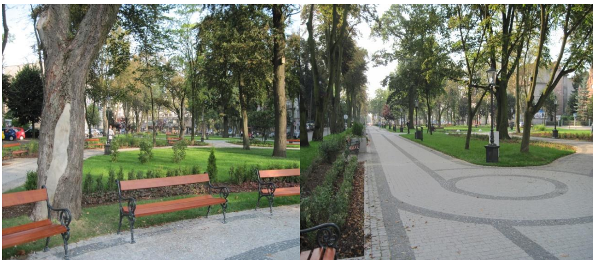
Park miejski w Elku