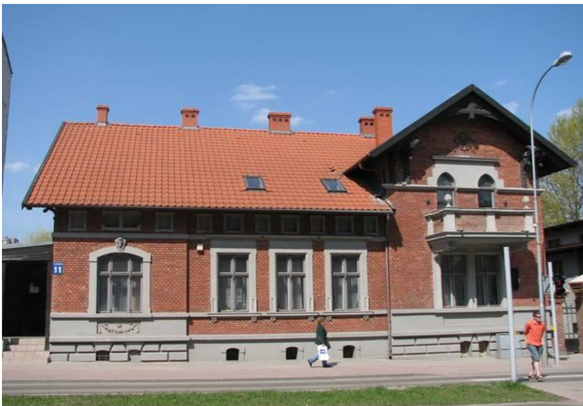
Budynek przy ul. Mickiewicza 11, fot. M. Karczewska