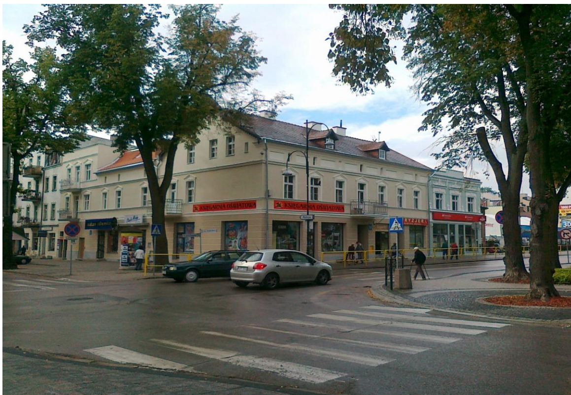
Kamienica przy ul. Armii Krajowej 18 / Chopina 2