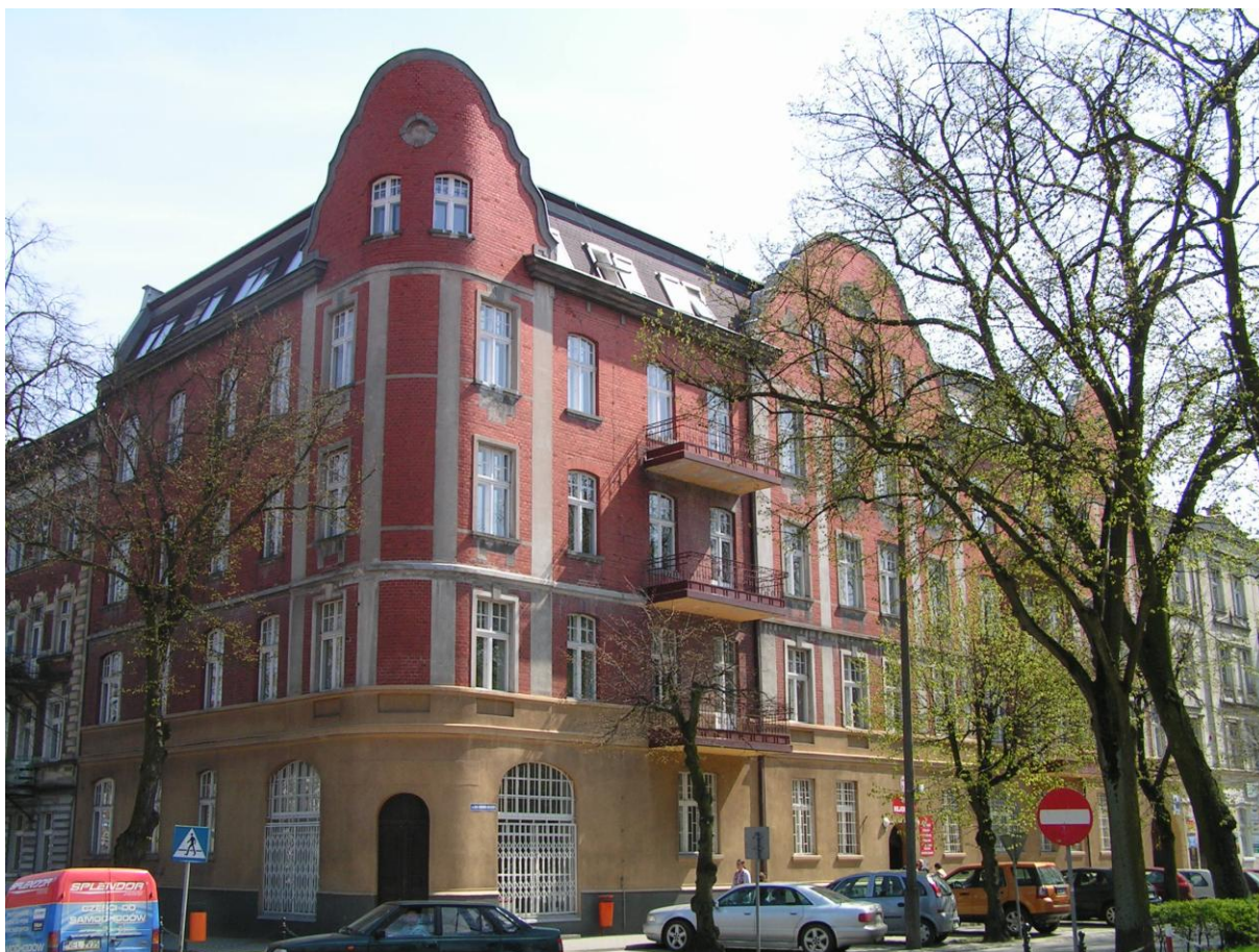
Kamienicy narożna przy ul. Małeckich 4