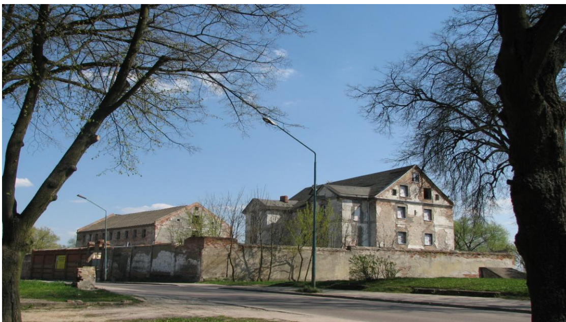
Budynek dawnego zamku krzyżackiego oraz więzienia na Wyspie Zamkowej w Elku