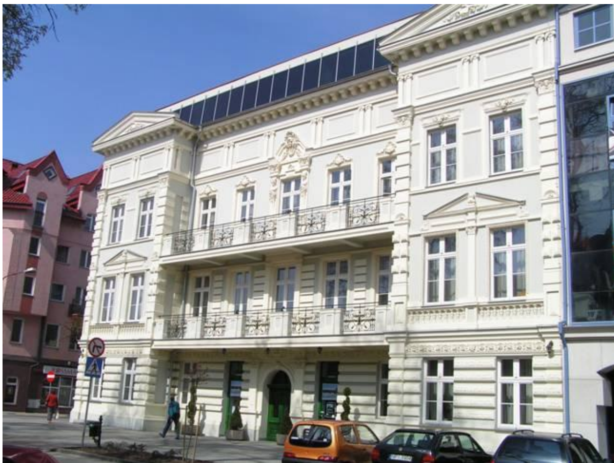
Wystrój okien pierwszej kondygnacji fasady kamienicy przy ul. Armii Krajowej 21