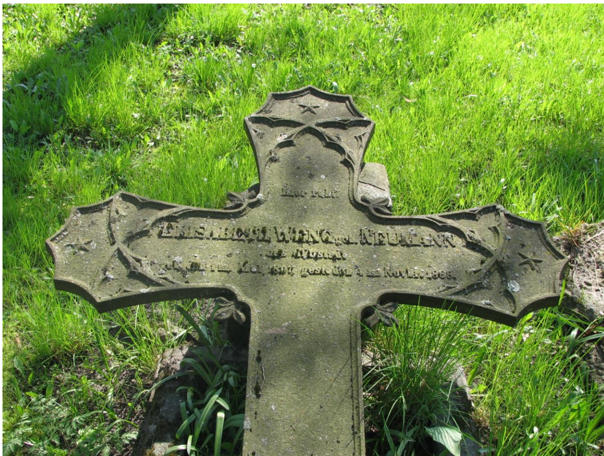
Krzyż żeliwny z 1885 roku z cmentarza katolickiego przy ul. Pięknej

groby dwóch żołnierzy niemieckich z czasów I wojny światowej, poległych w 1914 i 1915 r. Starodrzew - nasadzenie szpalerowe wzdłuż ogrodzenia: lipa, klon i kasztanowiec.