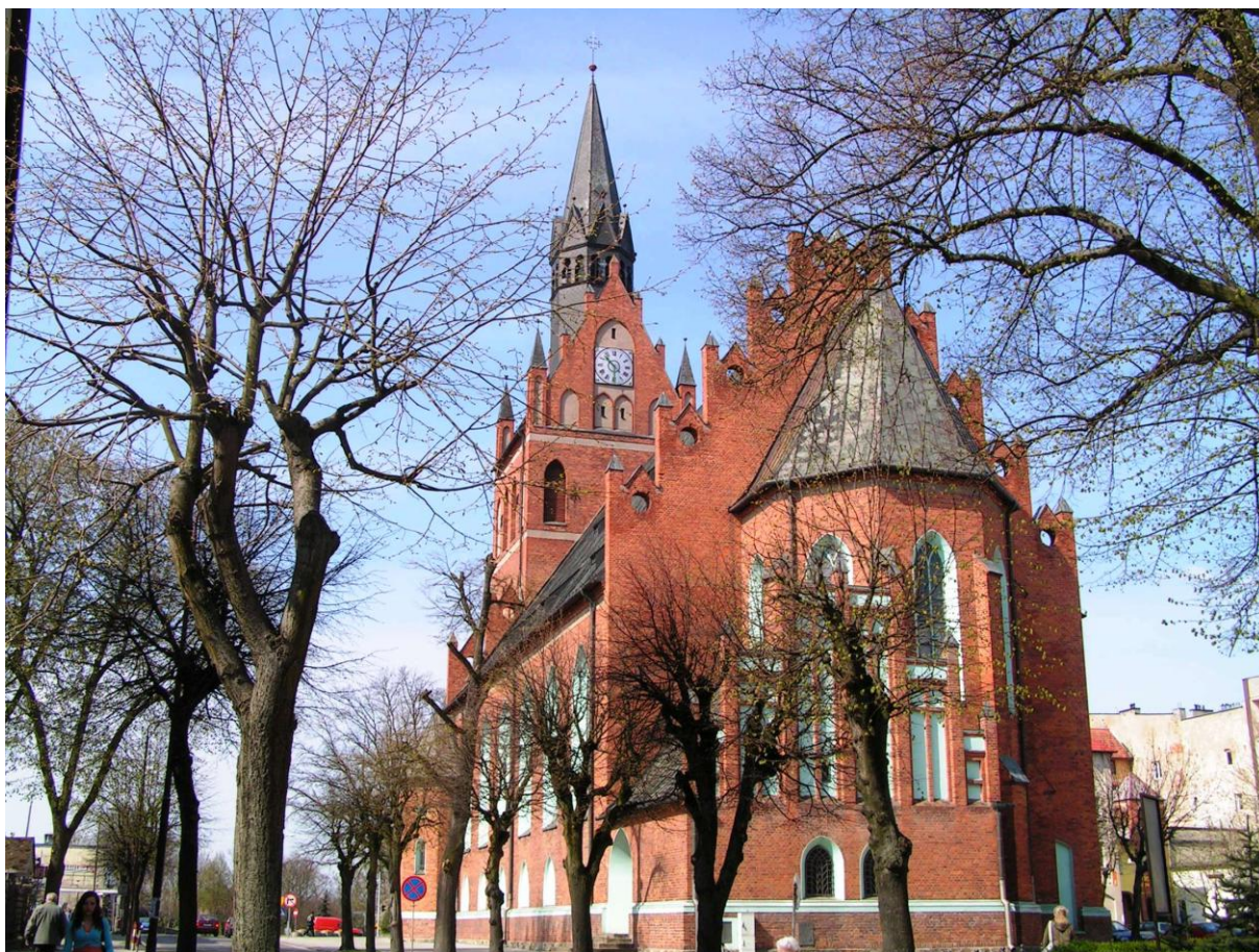
Kościół ewangelicki, obecnie rzymskokatolicki p.w. Najświętszego Serca Jezusowego