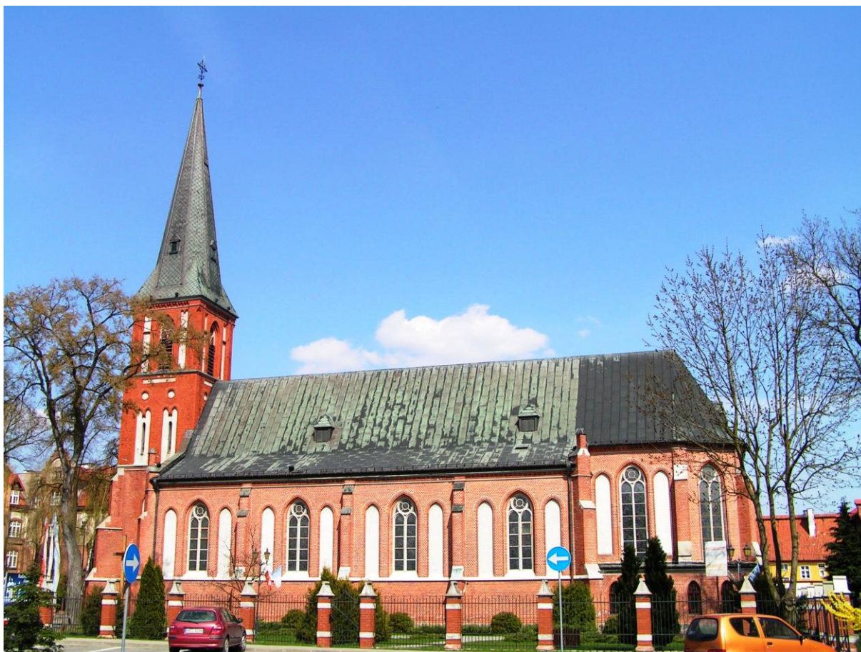
Kościół rzymskokatolicki p.w. św. Wojciecha