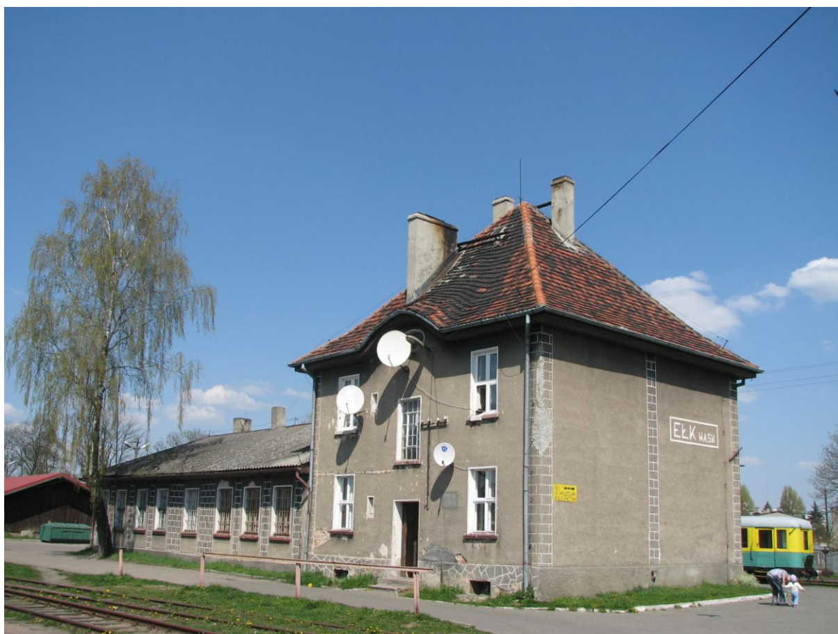
Główny budynek stacyjny Elckiej Kolej Wąskotorowej