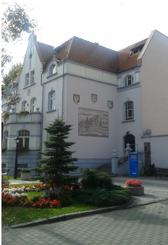
Budynek przy ul. Piłsudskiego 2, fot. Urząd Miasta Elku