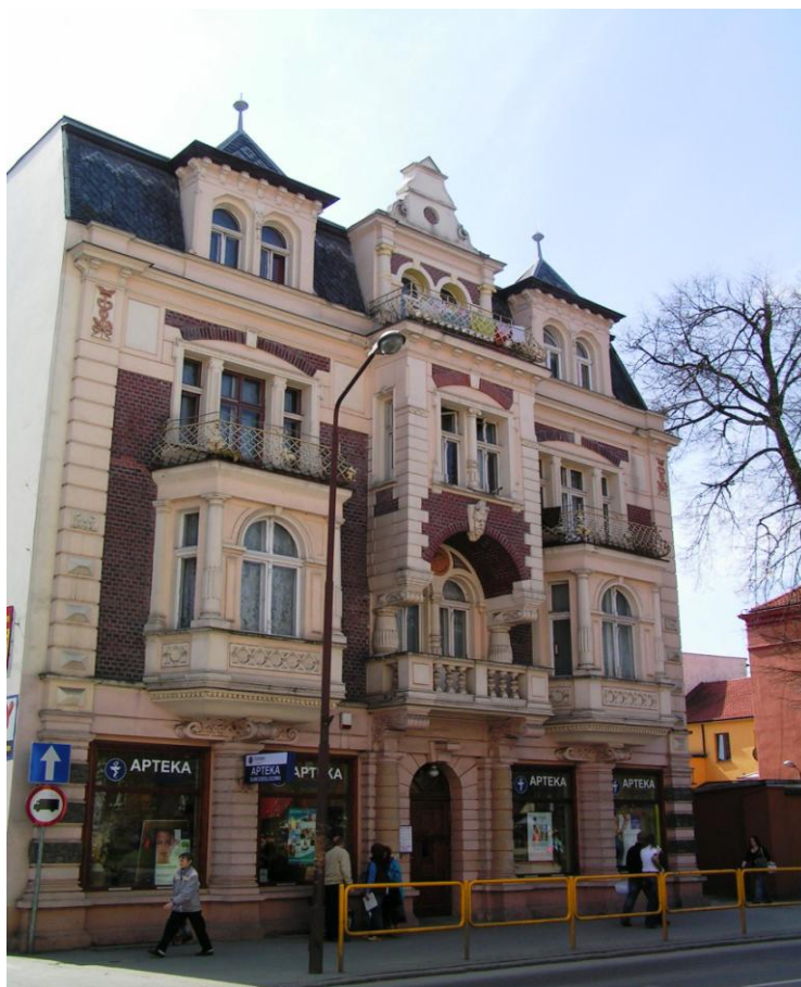
Fasada kamienicy przy ul. Armii Krajowej 20