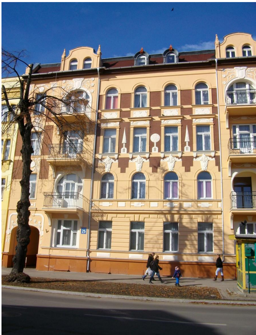
Kamienica przy ul. Armii Krajowej 25, fot. Urząd Miasta Elku.

poddaszem i ośmioosiową fasadą. Osie druga i siódma zryzalitowane. Otwory bram umieszczone w skrajnych osiach pierwszej kondygnacji, ujęte w portale z ornamentem roślinnym. Poza ryzalitami pierwsza i druga kondygnacja boniowana. Okna w osiach nad bramami zamknięte płasko, zdobione płycinami z ornamentem roślinnym. Okna w osiach między ryzalitami, w drugiej i czwartej kondygnacji zamknięte łukiem pełnym, w trzeciej kondygnacji – płasko, na wszystkich kondygnacjach zdobione zróżnicowanym detalem architektonicznym z motywami roślinnymi. W osiach zryzalitowanych, w drugiej, trzeciej i czwartej kondygnacji umieszczone balkony, w kondygnacji drugiej – balkon wgłębny, zamknięty łukiem podkowiastym, w kondygnacjach wyższych balkony z ażurowymi balustradami. Ryzality wieńczą dwuosiowe wystawki flankowane sterczynami z maskaronami.