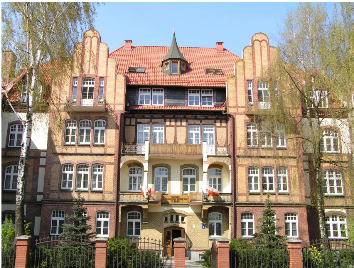
Fasada kamienicy przy ul. Kościuszki 9