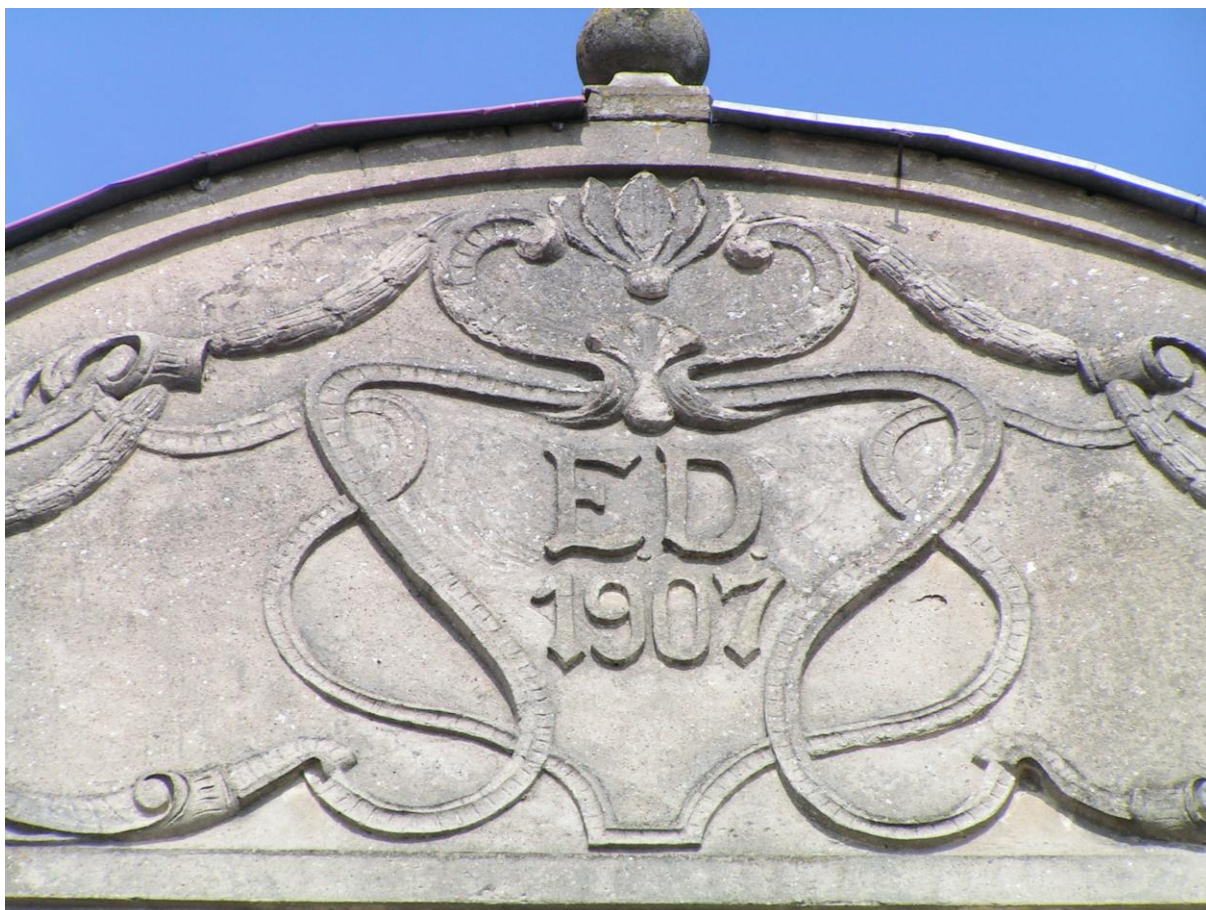
Attyka kamienicy przy ul. Armii Krajowej 23