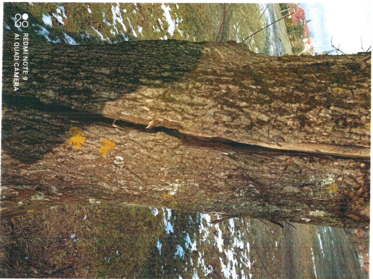
Древо ошаткане м/л