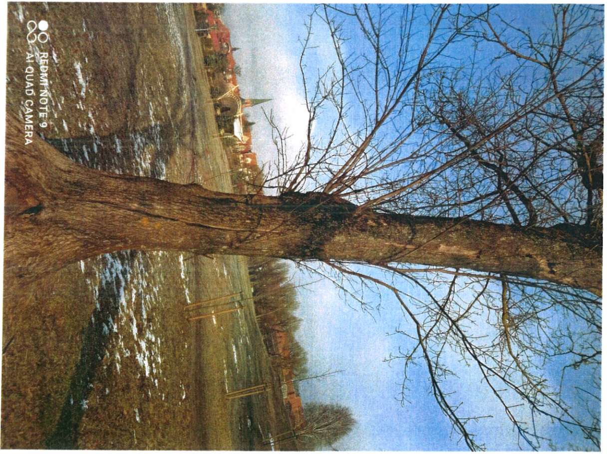
Древо ошаткане м/л