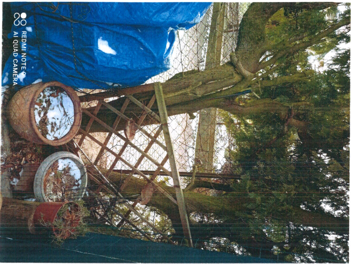
Disposizione in 3