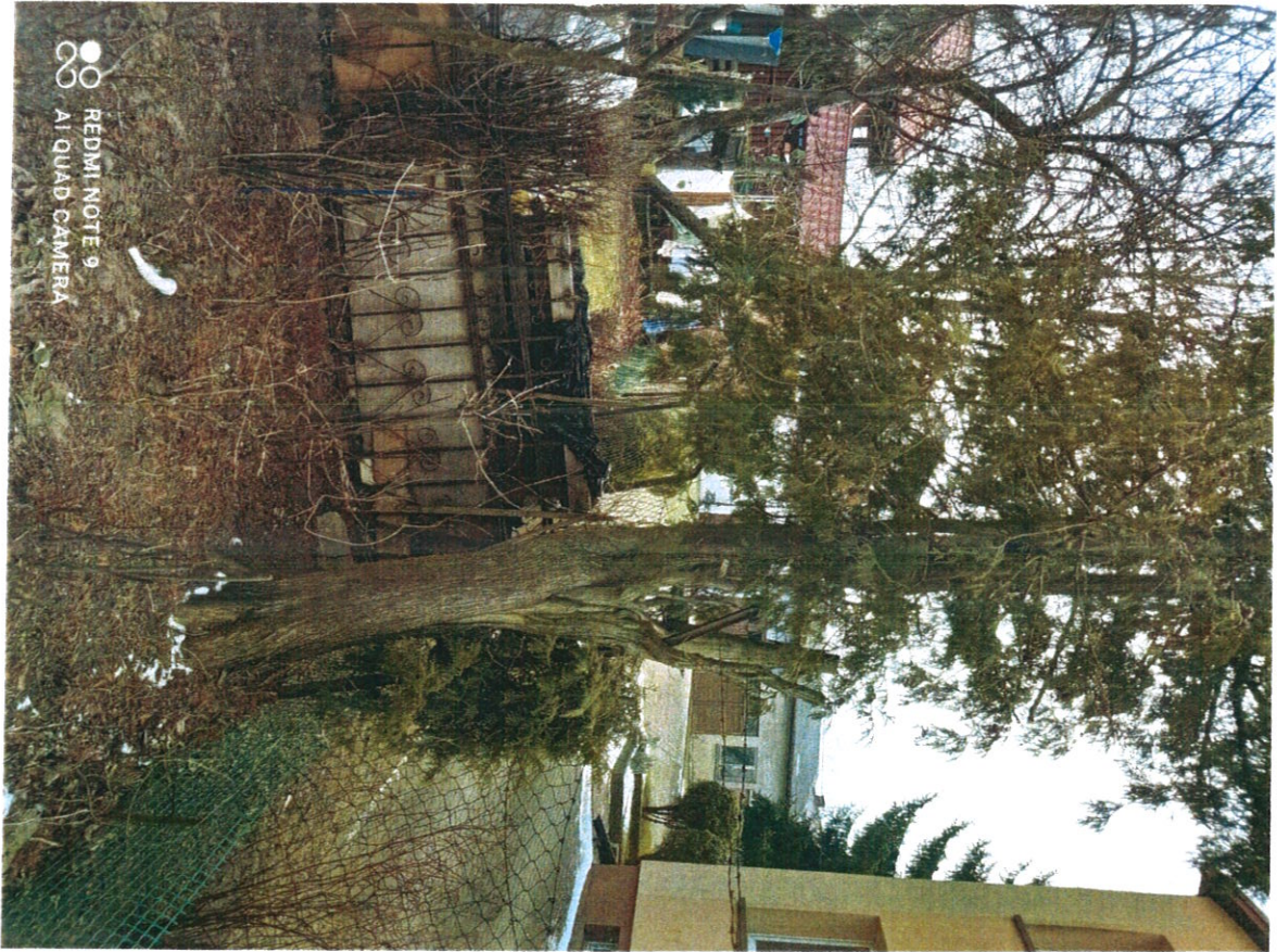
Древко осушаконе мр 4