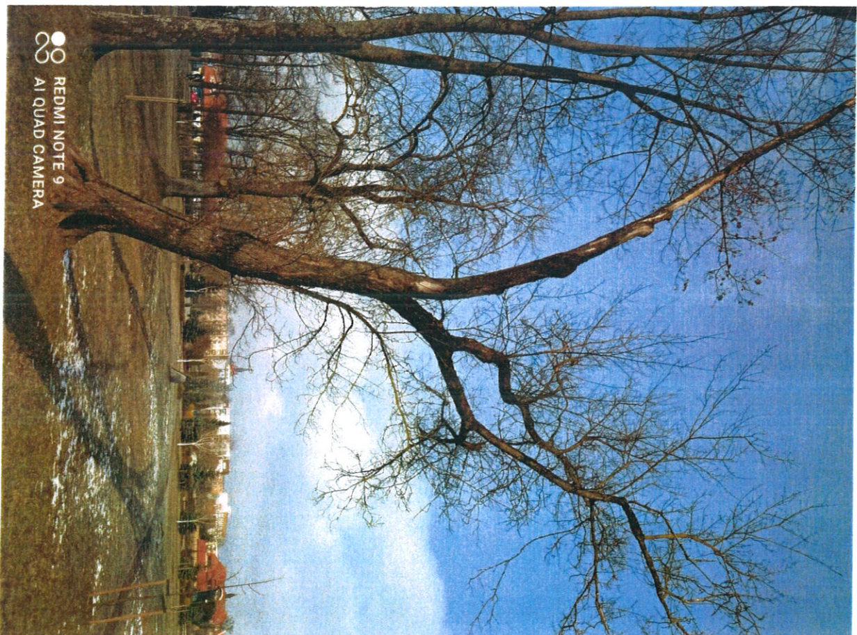
Древо острове м 8