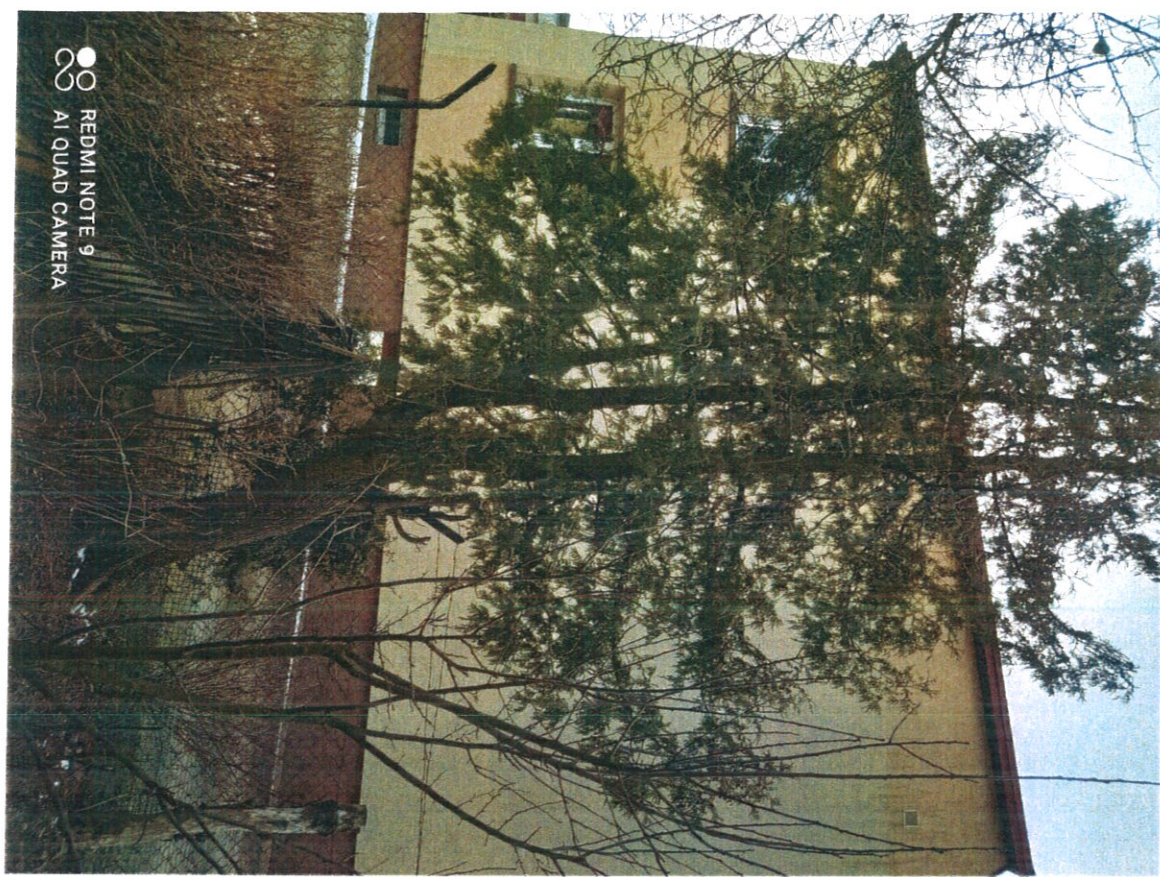
Древко осушаконе мр 4.