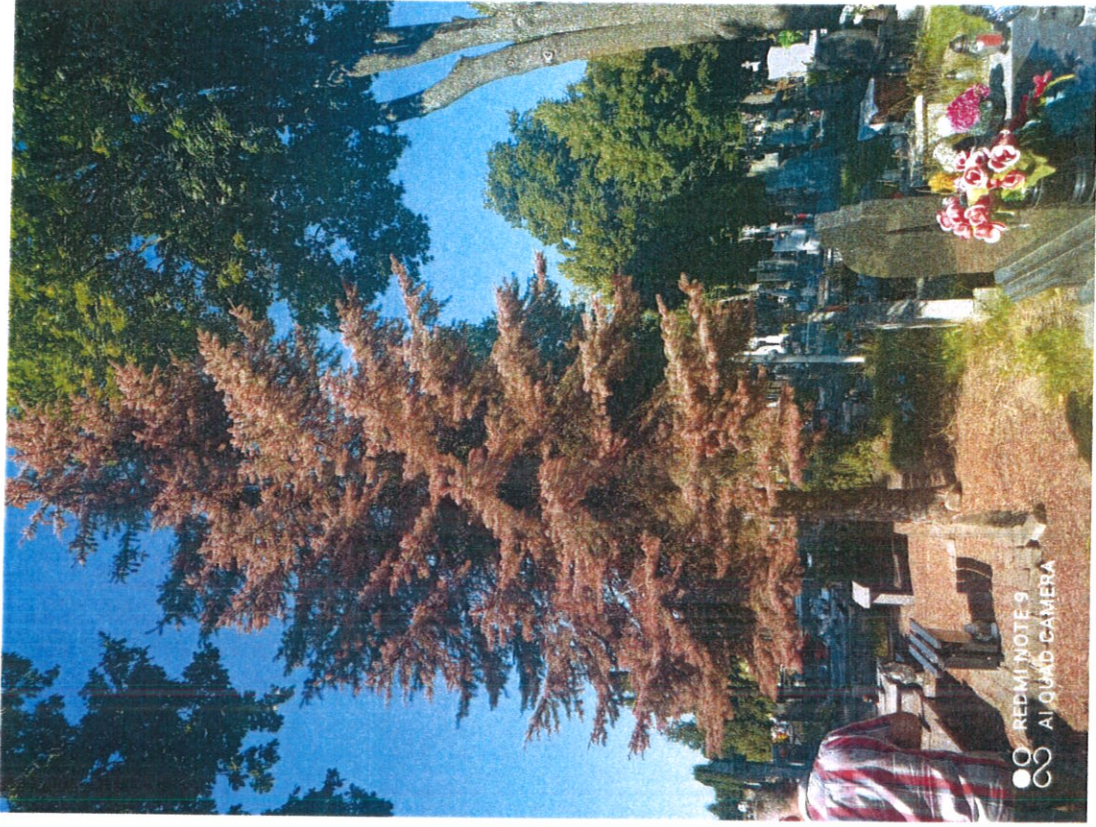
Drewo nr 1