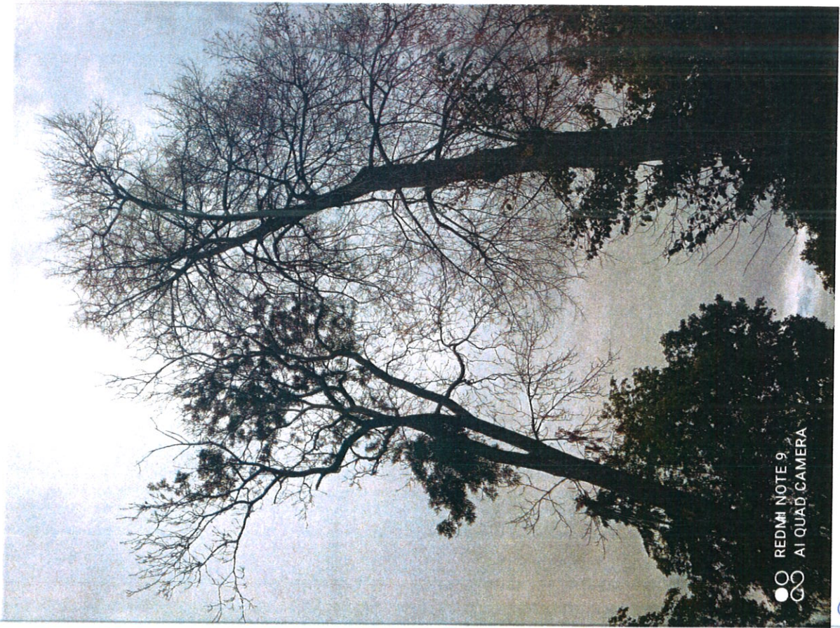
Drewo m 3