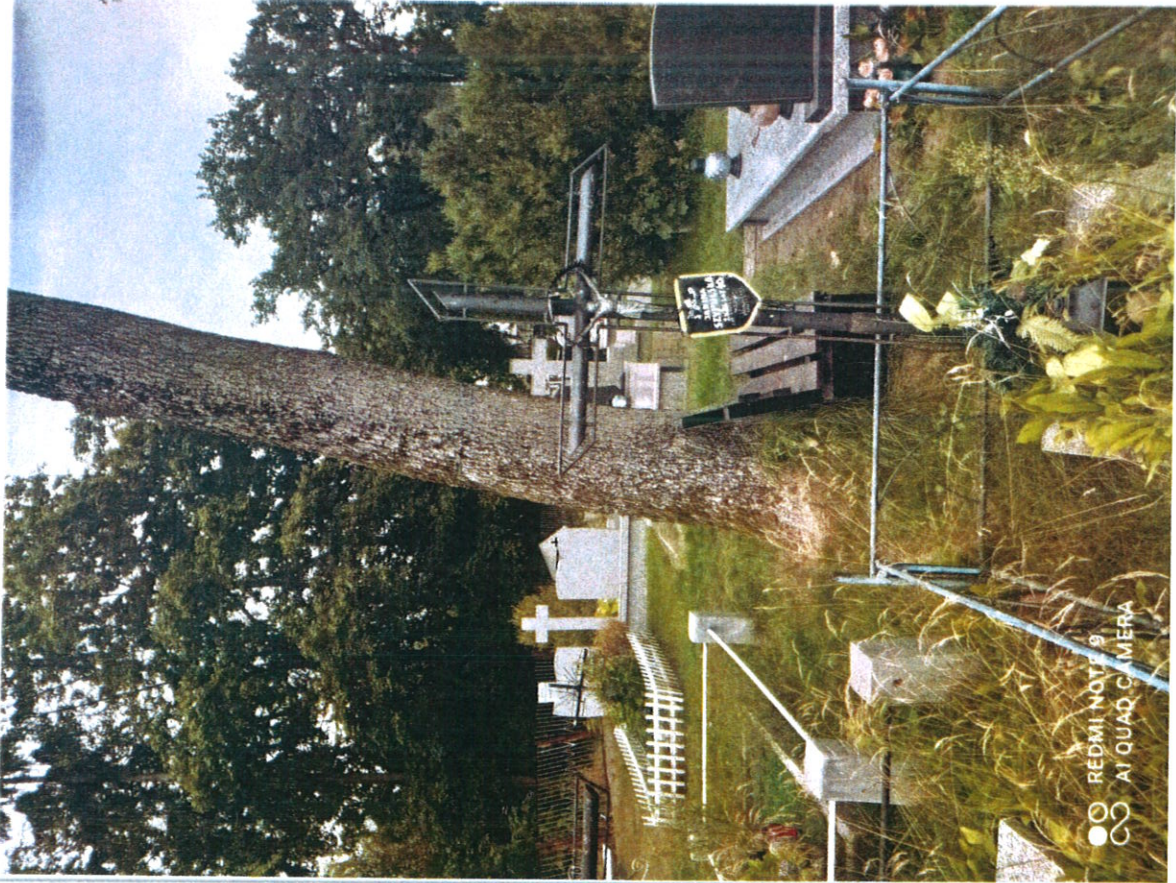
Drexler m 2 C/14/18/CA