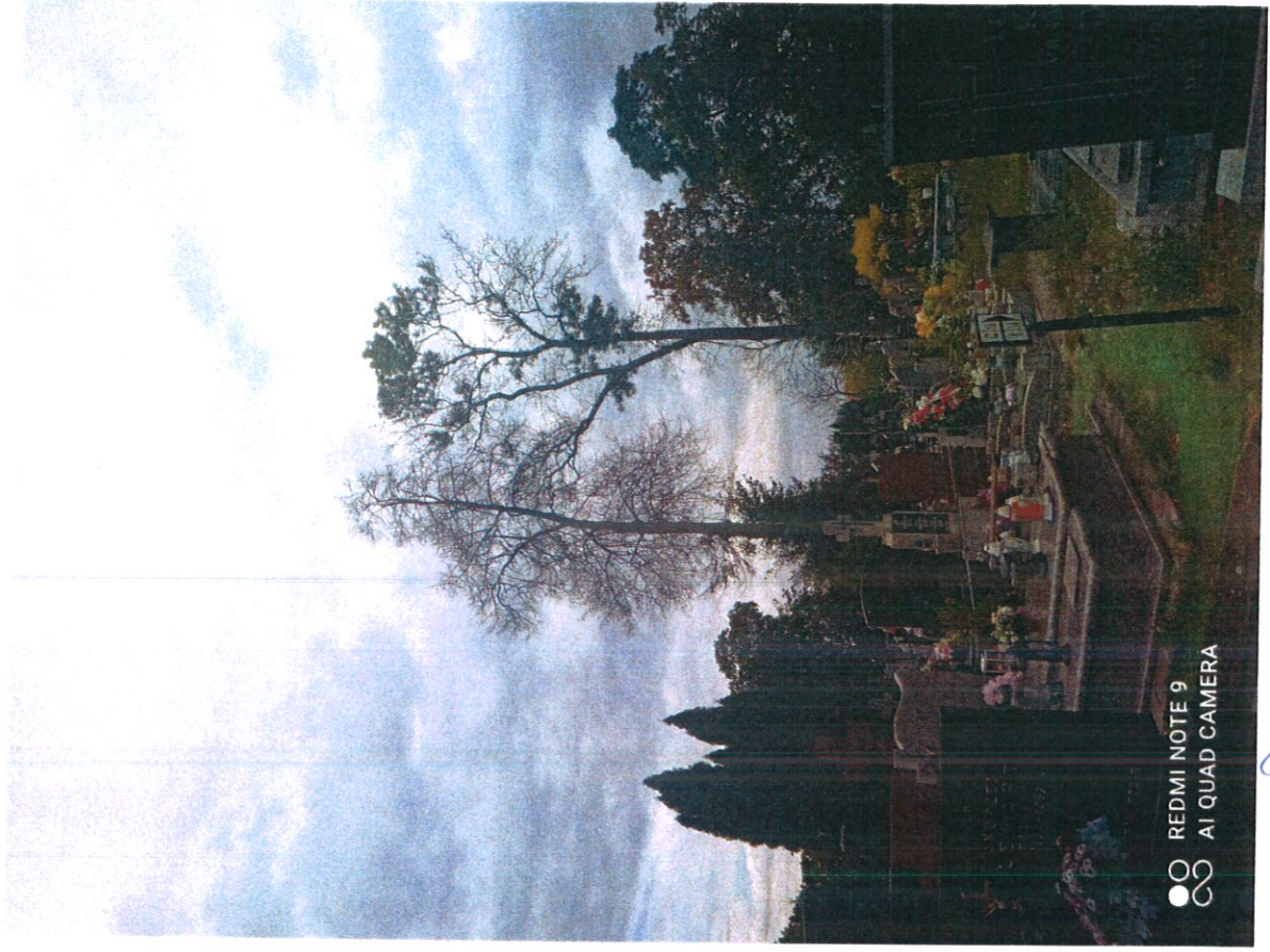
Drewo m 3