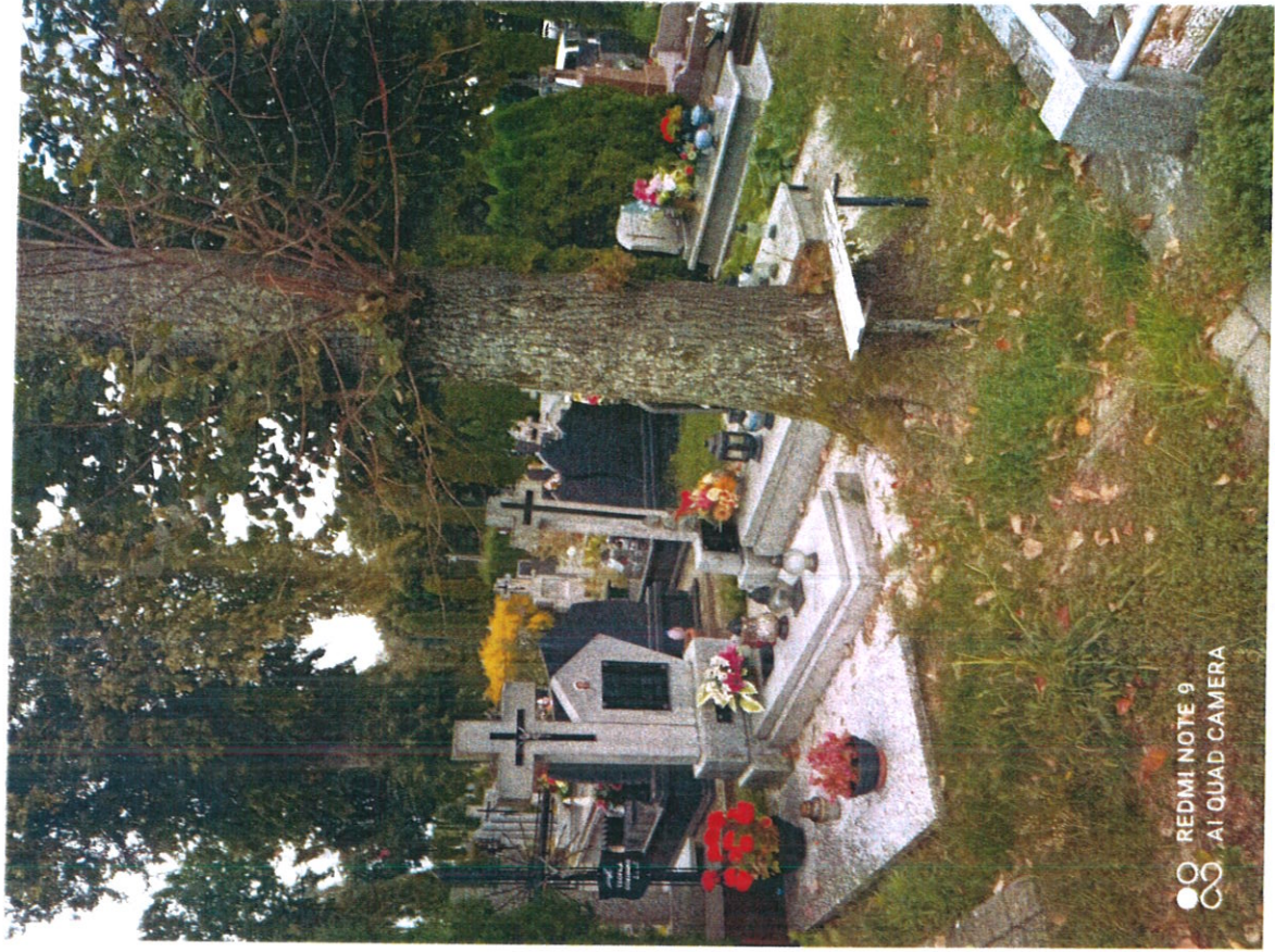
C/14/14/CA Drexler m 3