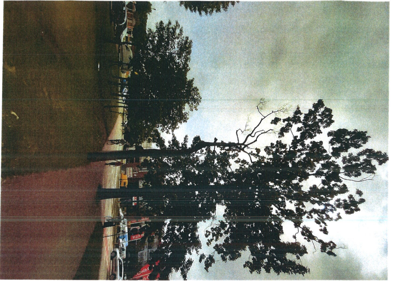
Disicuda m 3055/5