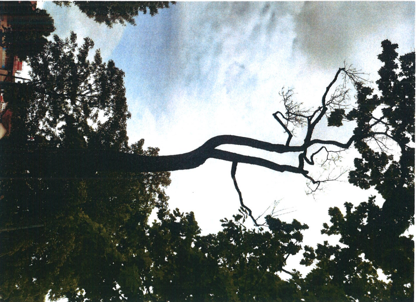
okioaka. WY 3055/5