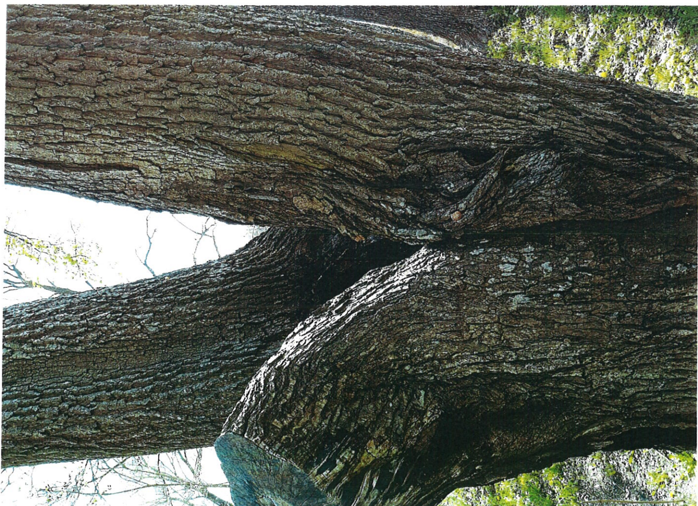
02. IV 38 - u. M. Litopeda