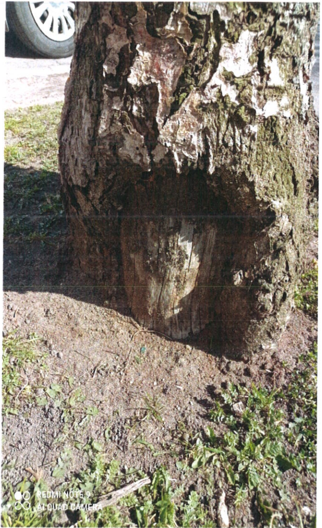
Drewo nr 1