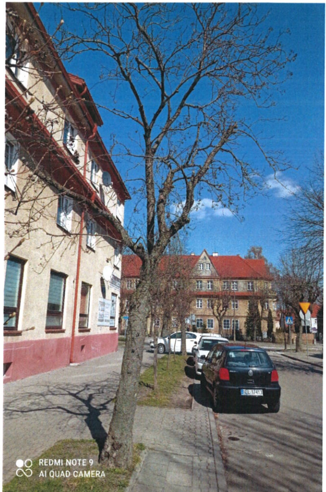
Drzewo nr 2