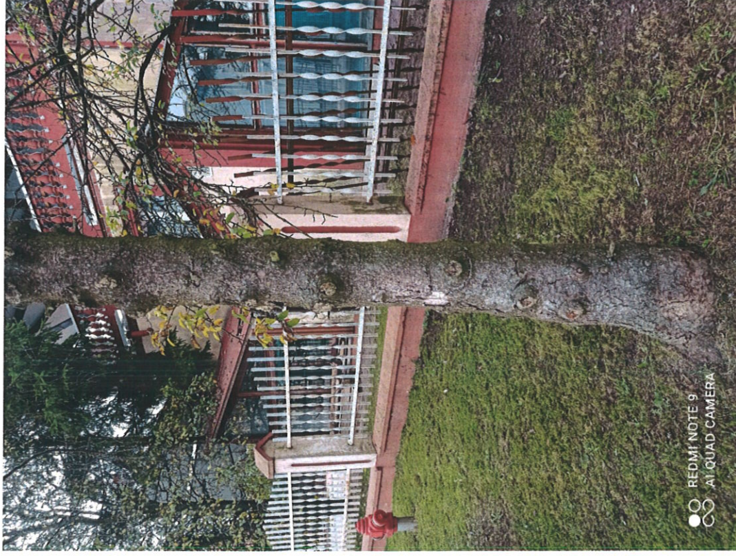
Inreuo amaraone m 4