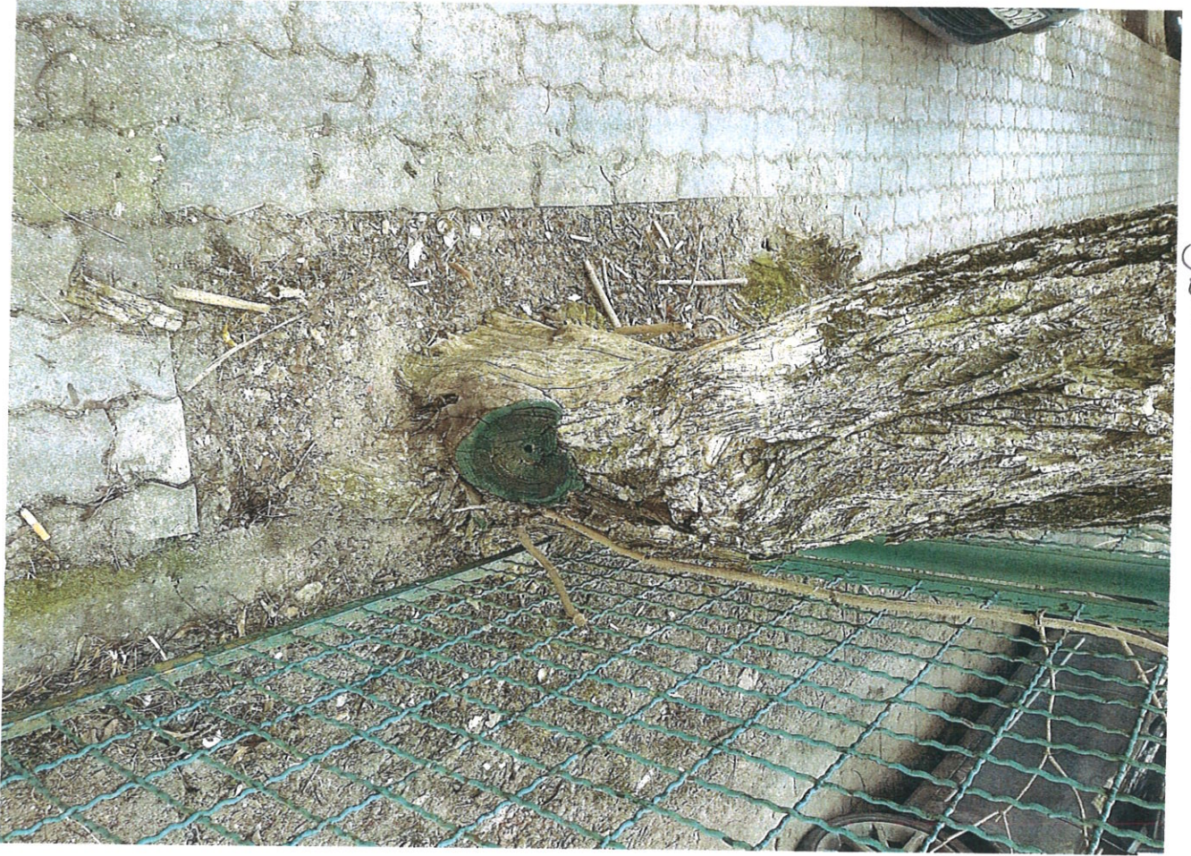
Дерево м 2