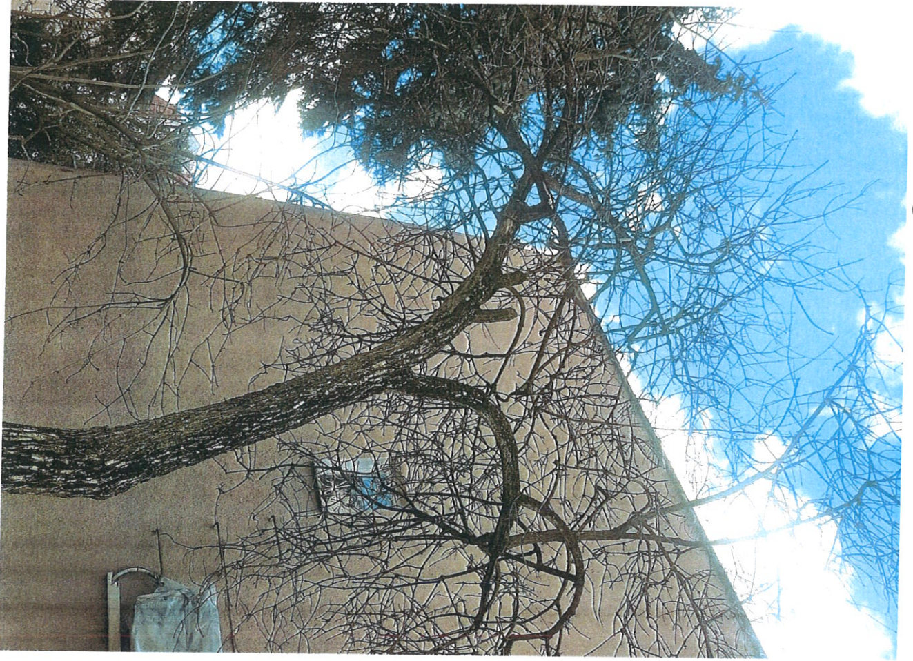
Orange Mt J