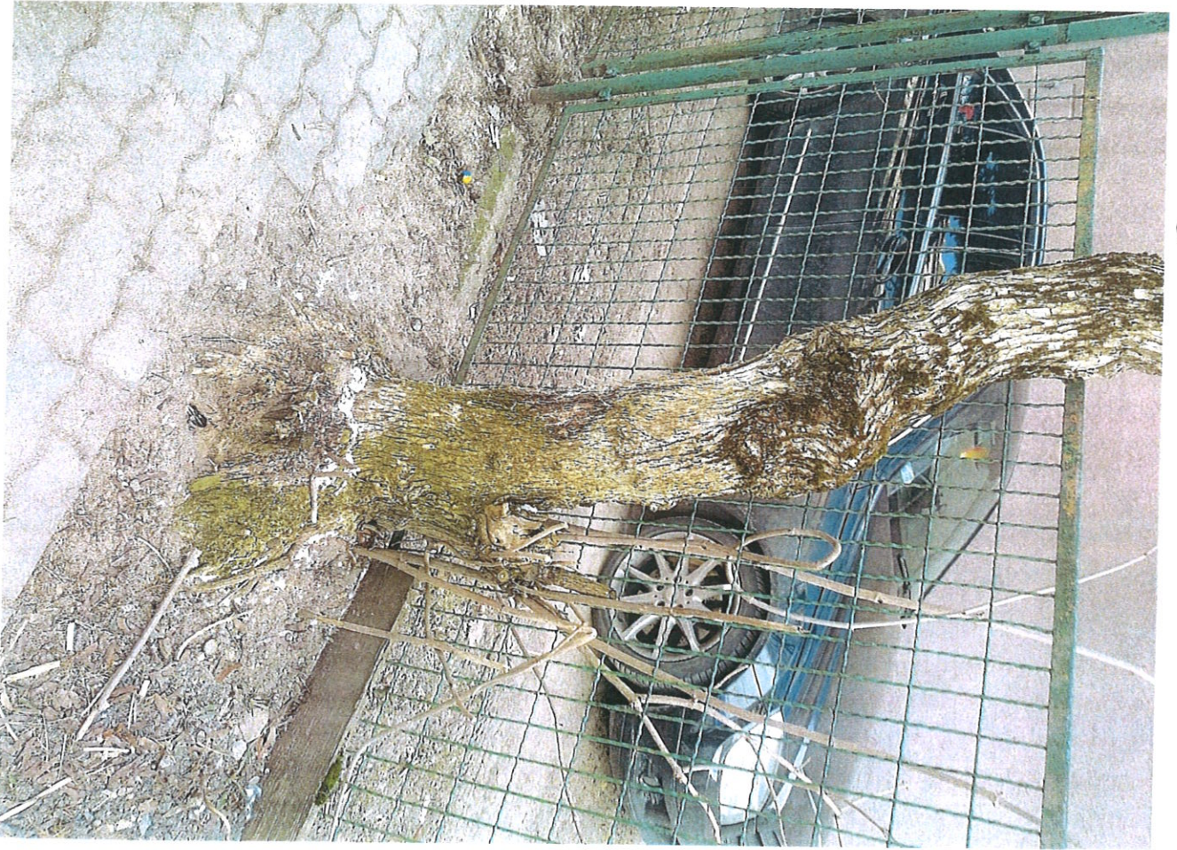
Дерево м 2