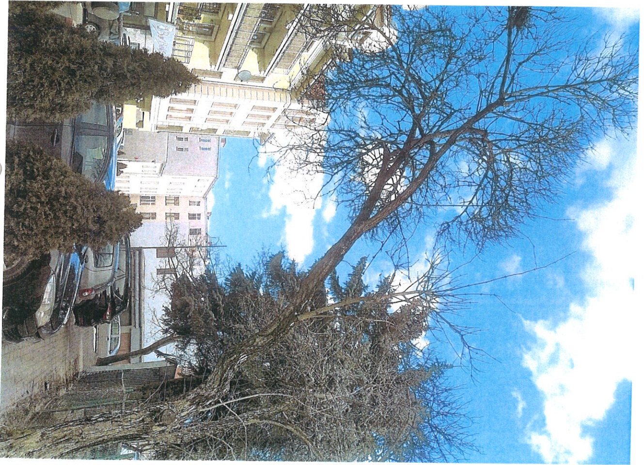
Orange Mt J