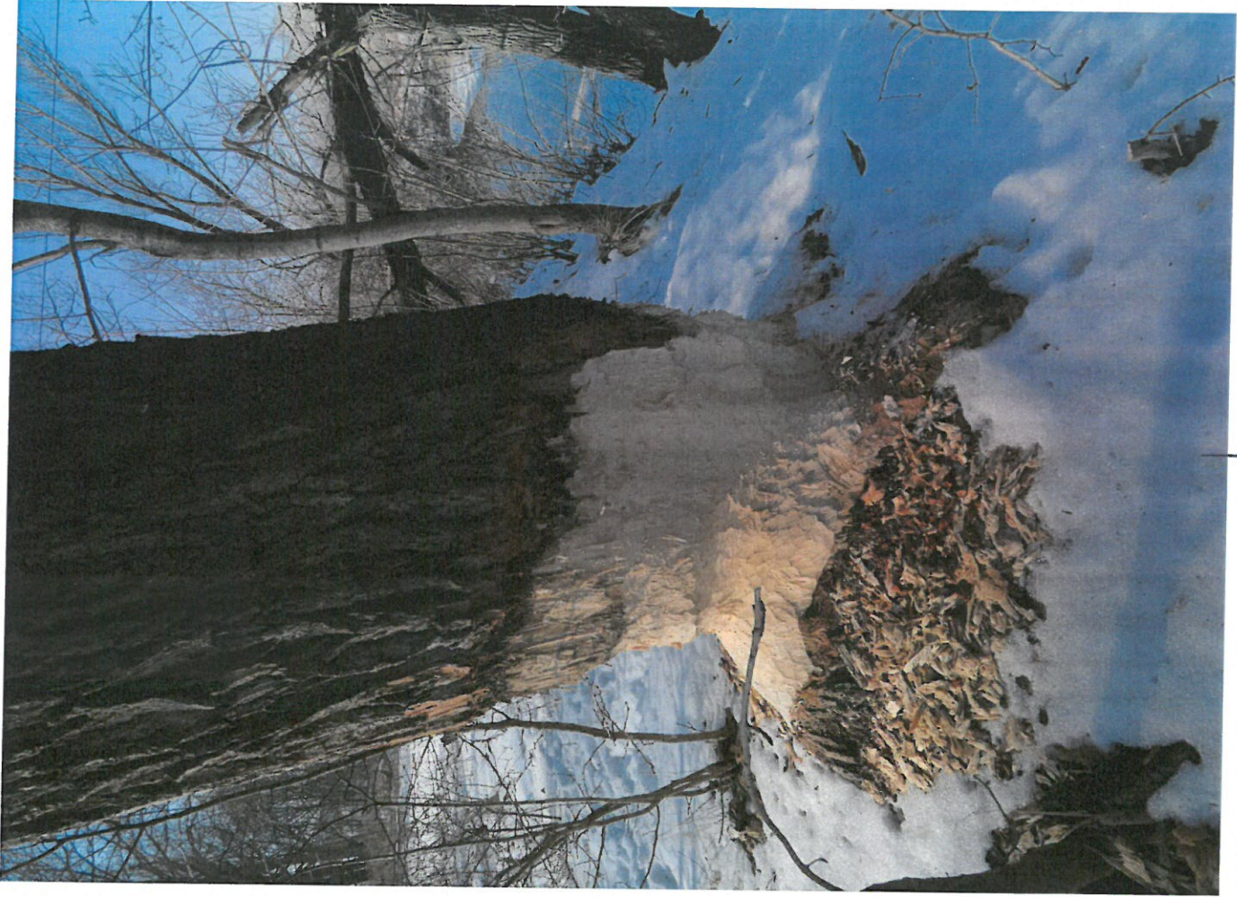
DR250 MR 4