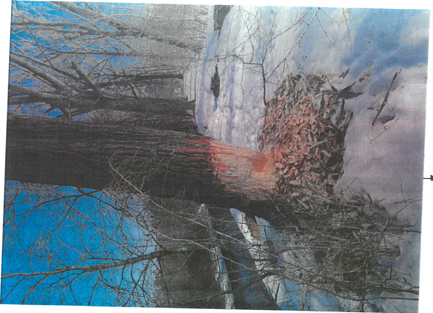
ძირსო № 3