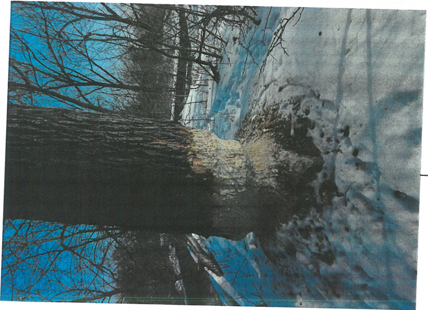
ძირსო № 1