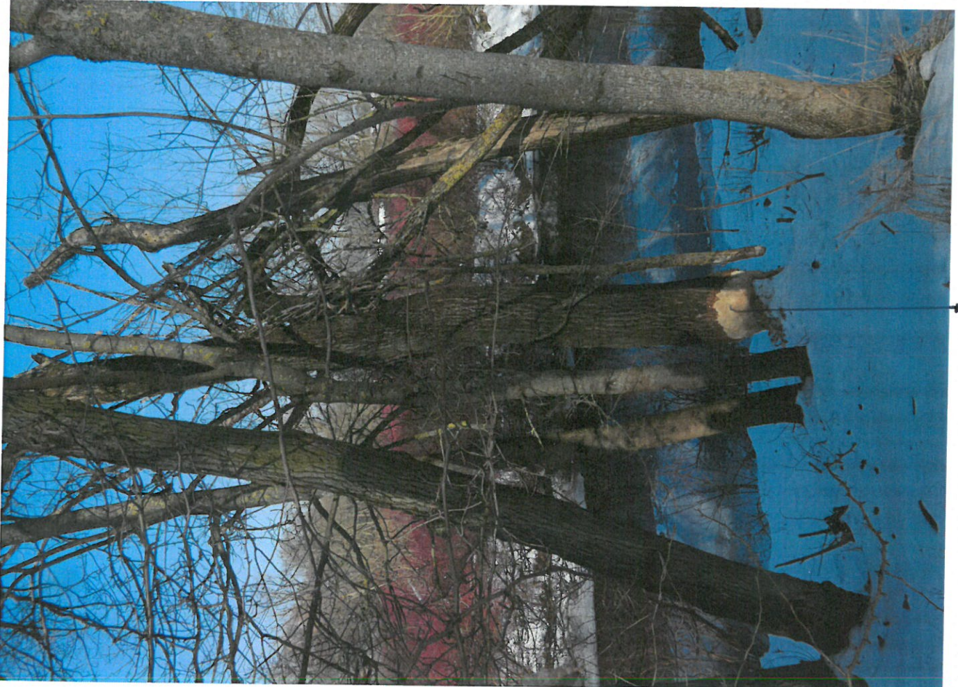
DR250 MR 4