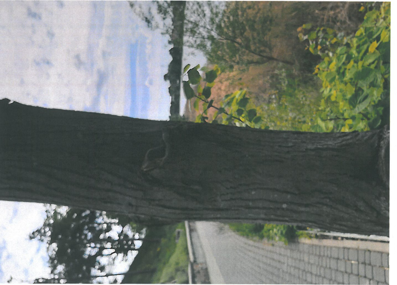
DRZEWO NR 5