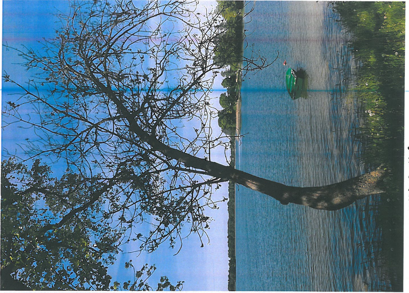
PRZEŁO NR 2