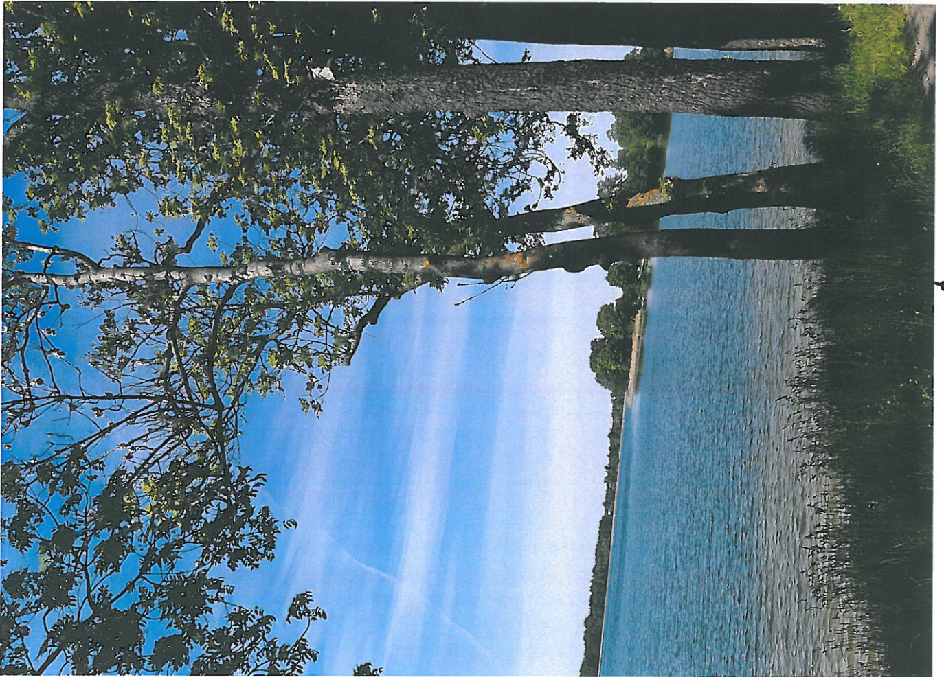
PRZEŁO NR 3