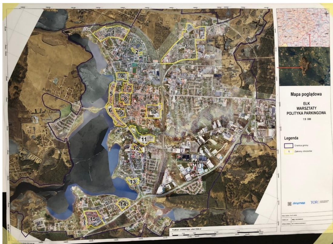
Mapa poglądowa z wyznaczonymi obszarami do dyskusji

Przed rozpoczęciem prac w każdej z grup wybrano sekretarza. Każdy z etapów dyskusji był określony czasowo i miał swój cel. W pierwszej kolejności należało opisać i zdefiniować zaistniałe problemy. Następnie do każdego z problemów przypisano przyczynę, która jest powodem takiego stanu rzeczy. A w trzeciej fazie wybrano rozwiązania do poszczególnych problemów. Takie podejście pozwalało na szczegółowe opisanie zagadnień oraz umożliwiało szersze spojrzenie na wybrany temat. Jednoznaczny podział pracy nadaje kierunek i ramy dyskusji oraz nie pozwala, aby za szybko szukać rozwiązań do problemów, które opisane są dość chaotycznie. Wybrany model sprawdził się bardzo dobrze, ponieważ opis przyczyn udawdniał uczestnikom, że prawdziwy powód nie jest często tak oczywisty jak może się powszechnie wydawać.