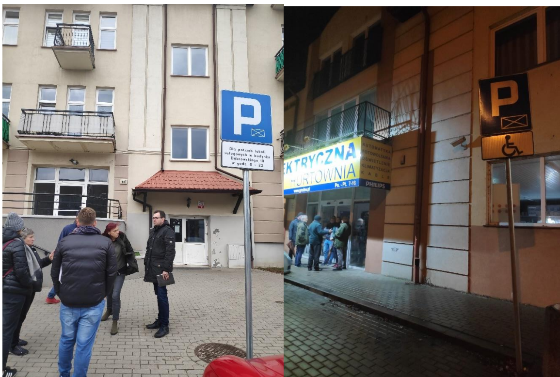
Uczestnicy spacerów badawczych

W spacerach wzięło udział w sumie ponad 150 osób. W zależności od obszaru i aktywności uczestników zidentyfikowano szereg miejsc problematycznych, w rozmowach z mieszkańcami pojawiły się także propozycje rozwiązań, które zostaną opracowane szczegółowo i przedstawione w raporcie podsumowującym prace nad polityką parkingową miasta Ełku w I kwartale 2020 roku.