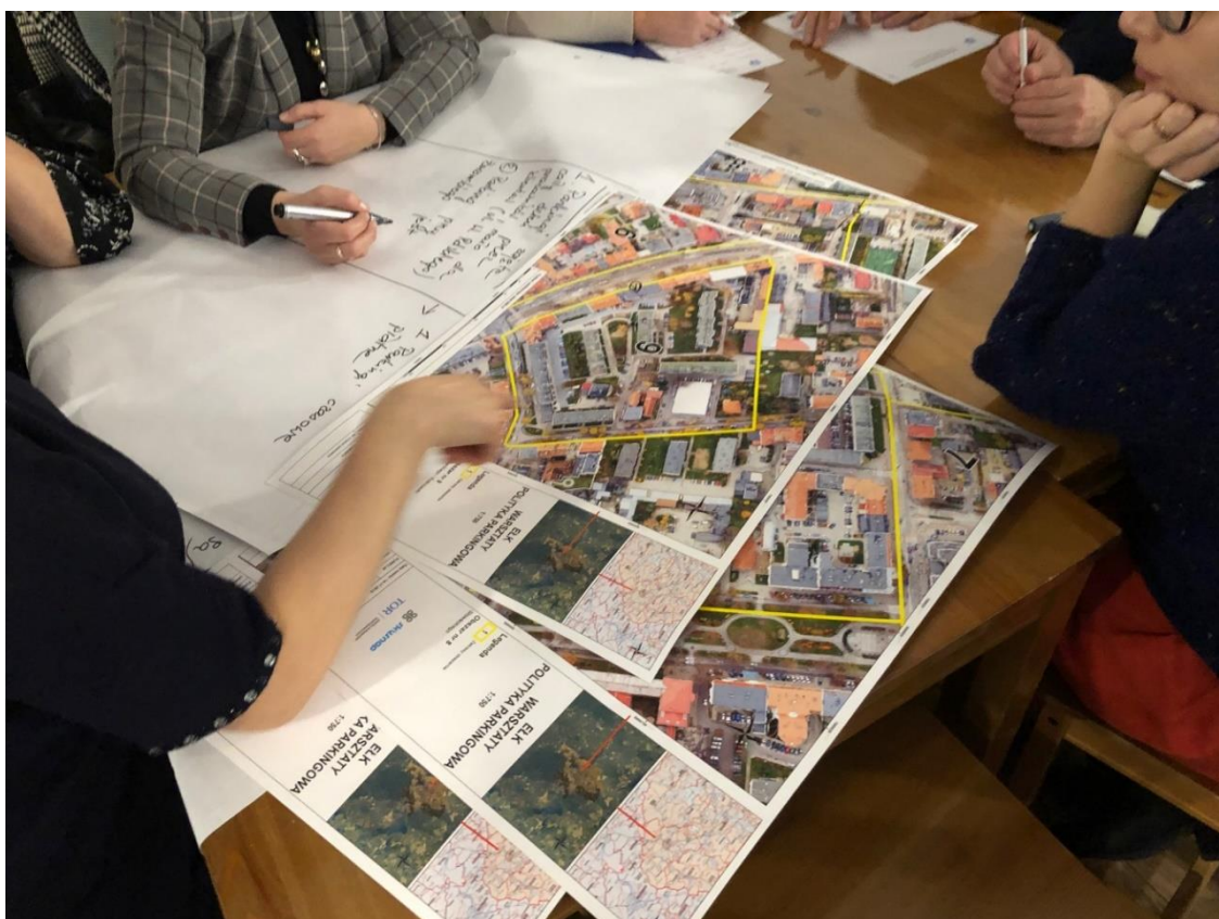
Przykładowe mapki z wyznaczonymi obszarami, które zostały rozdane uczestnikom

Po realizacji trzech etapów pracy grupy miały za zadanie wybrać pięć najważniejszych wniosków/pomysłów/usprawnień, które chciały przedstawić innym grupom na forum. W trakcie trwania prezentacji każdej z grup inni uczestnicy mogli odnieść się do wyników prac lub uzupełnić omawiane wnioski.