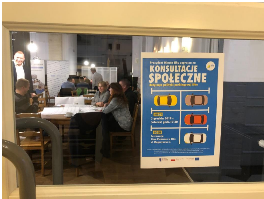
Plakat promujący warsztaty

Formuła Open Space opiera się na kilku głównych zasadach (poniższe zasady zostały dopasowane do potrzeb tego warsztatu):