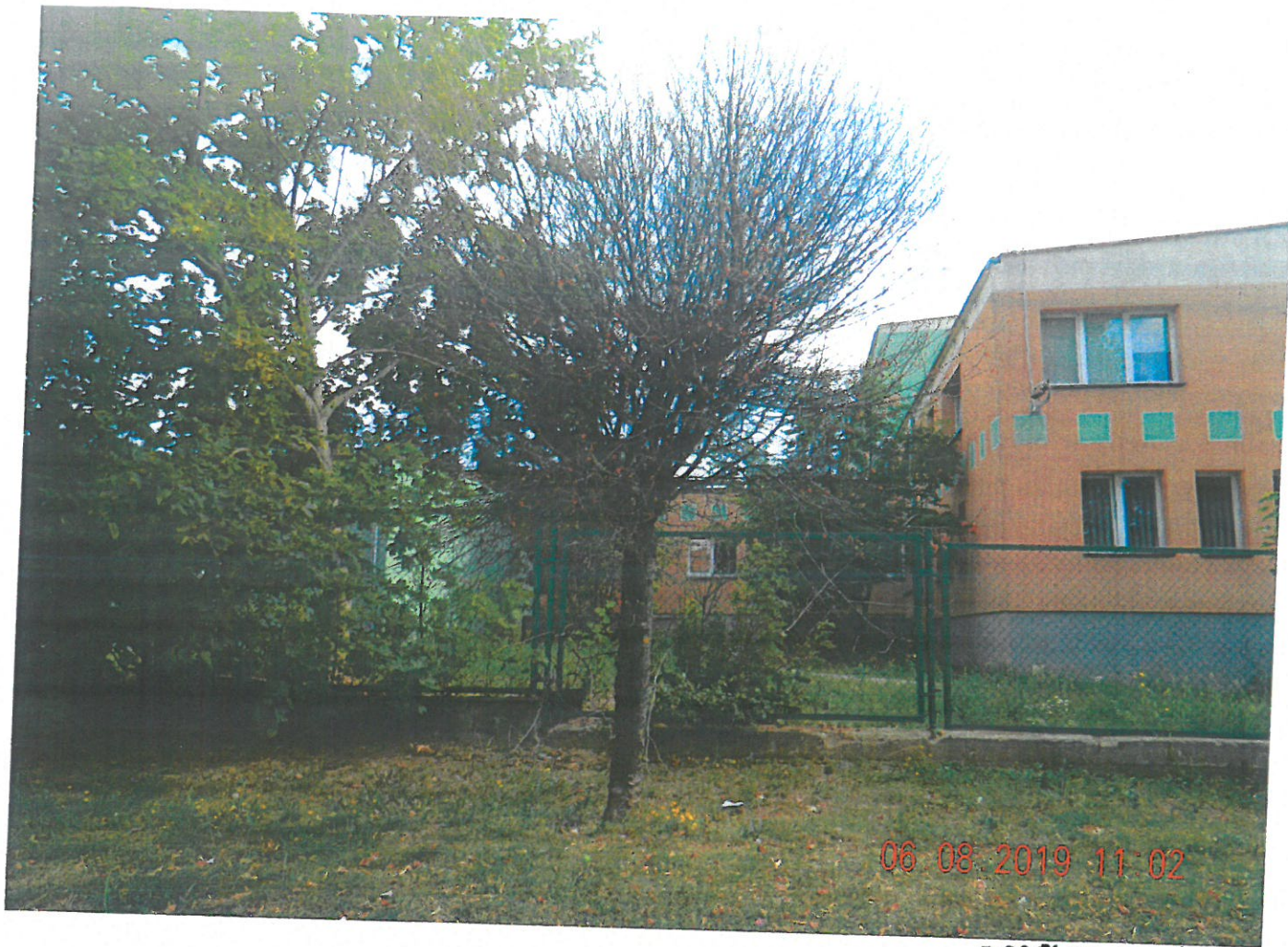
DRZEWO NR 1