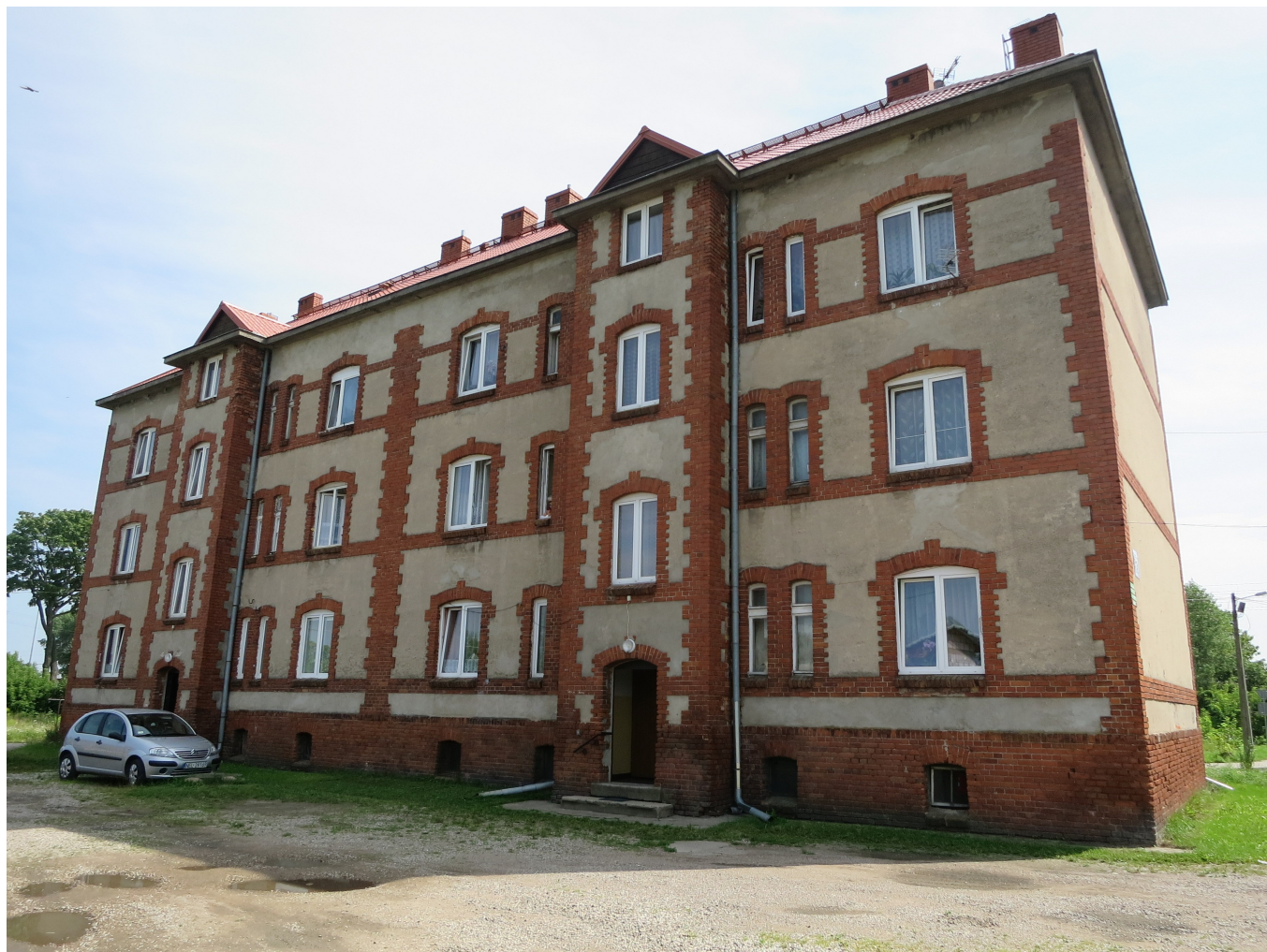
Widok ściany frontowej i szczytowej z SE na NW

8. Fotografia z opisem wskazującym orientację: