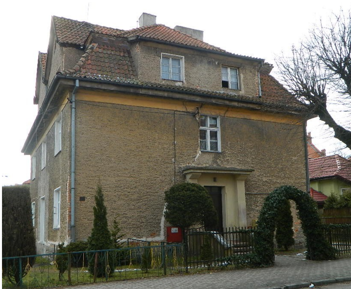
Widok ściany frontowej z NW na SE

8. Fotografia z opisem wskazującym orientację: