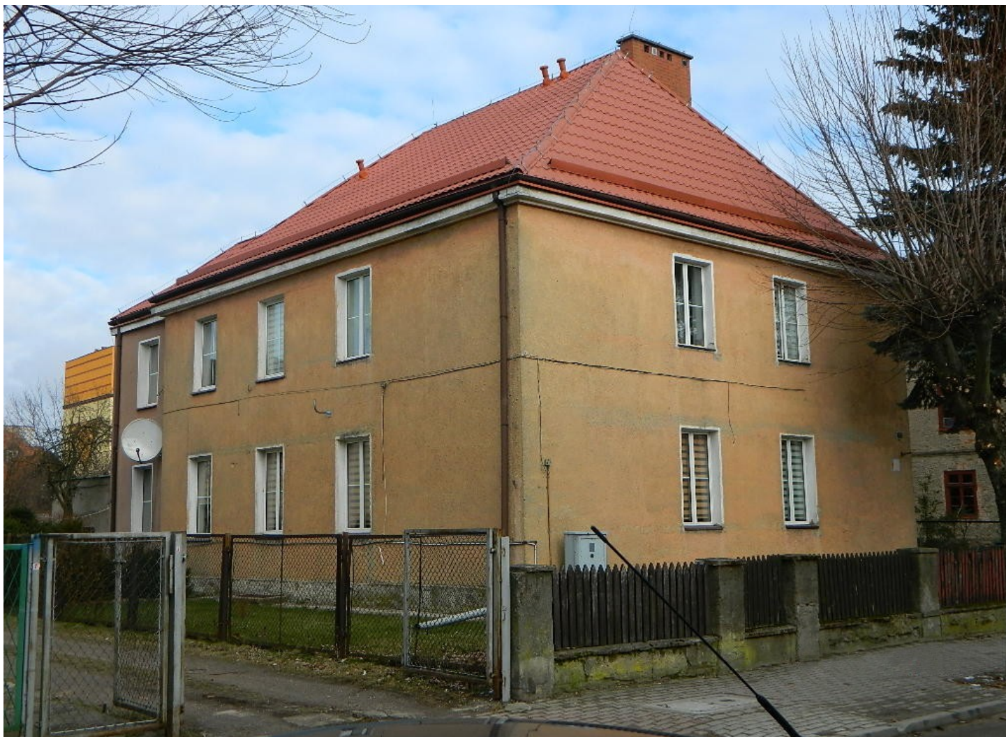
Widok ściany frontowej i szczytowej z SW na NE

8. Fotografia z opisem wskazującym orientację: