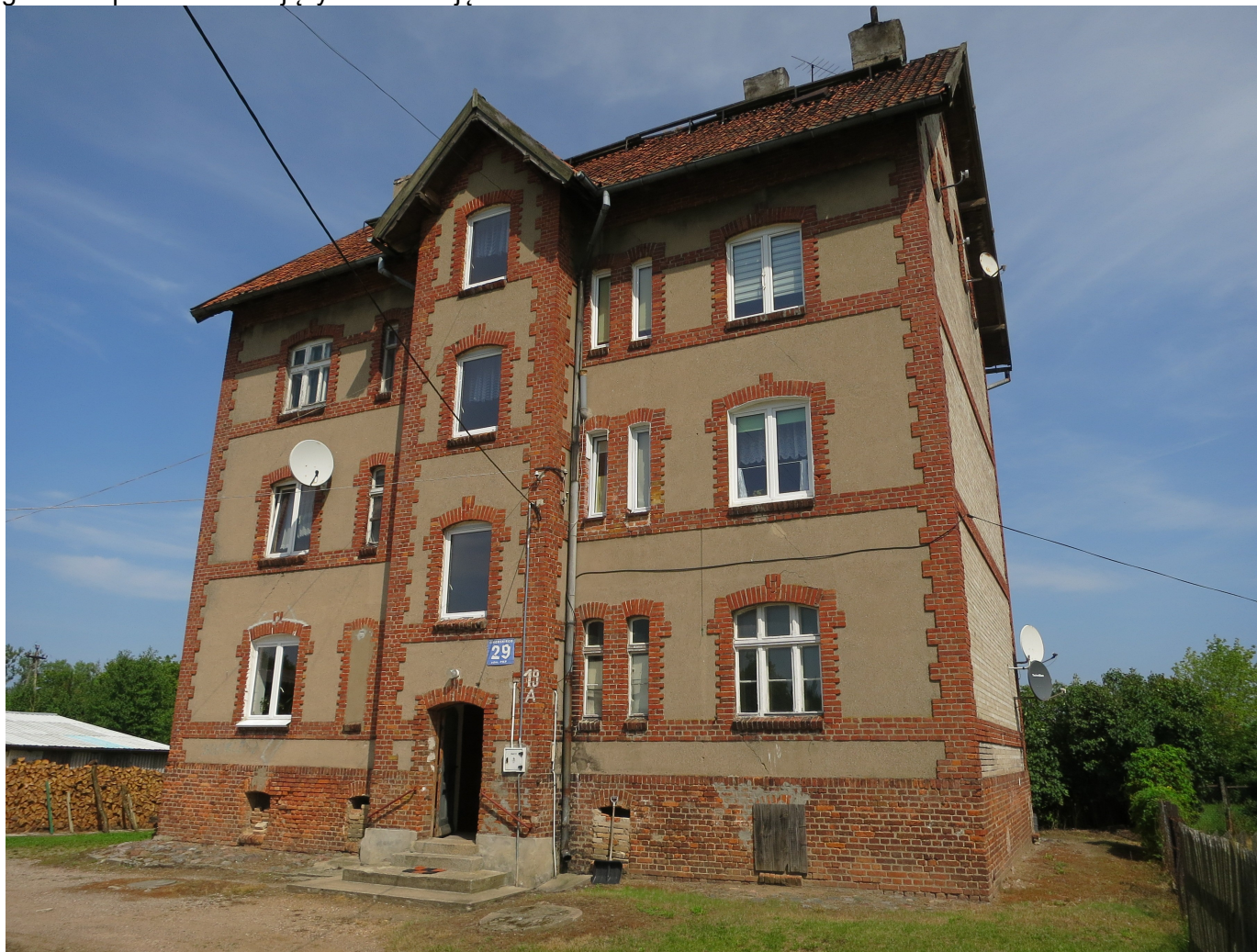
Widok ściany frontowej i szczytowej z SW na NE

8. Fotografia z opisem wskazującym orientację: