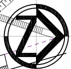
WYRYS ZE SUDIUM UWARUNKOWAŃ I KIERUNKÓW ZAGOSPODAROWANIA PRZESTRZENNEGO MIASTA ELKU