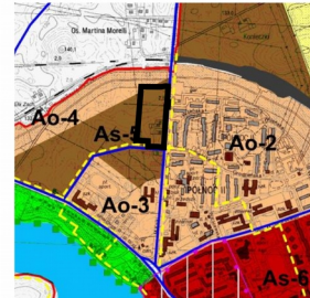
TEREN OBJĘTY OPRACOWANIEM