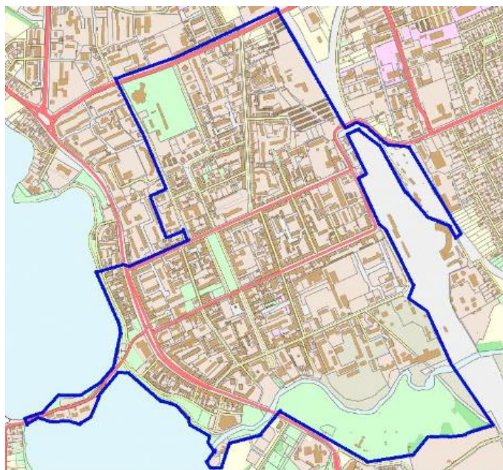
Rys. nr 1. Obszar śródmieścia w mieście Ełk wyznaczony do rewitalizacji, źródło: Program Rewitalizacji Ełku na lata 2016 - 2023